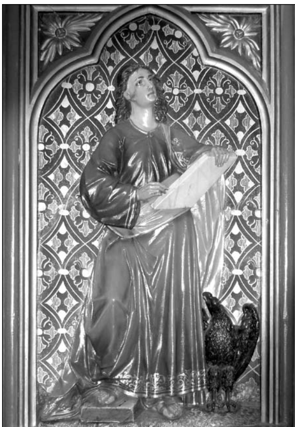
Szent János evangélista. Zenta, Jézus Szíve templom, 2012