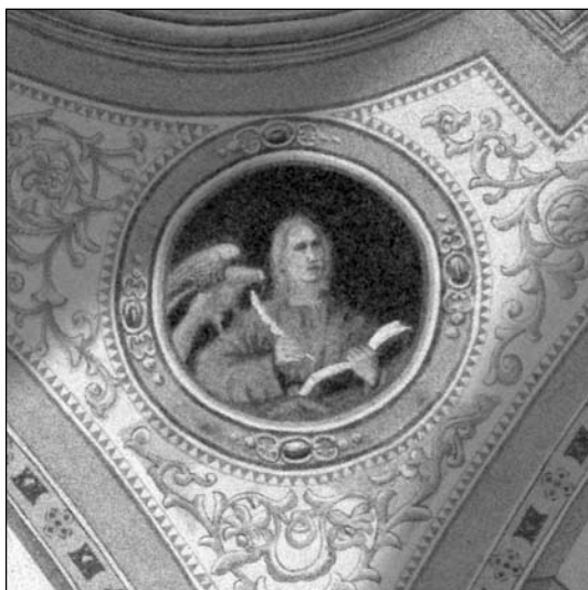
Szent János evangélista. Törökbecse, 2012