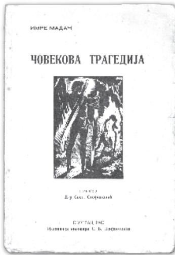
A Madách-fordítás címlapja

ráltság közti örök barátsági szerződést, amit aztán csak négy hónap múlva követett a Délvidék katonai visszacsatolása.)