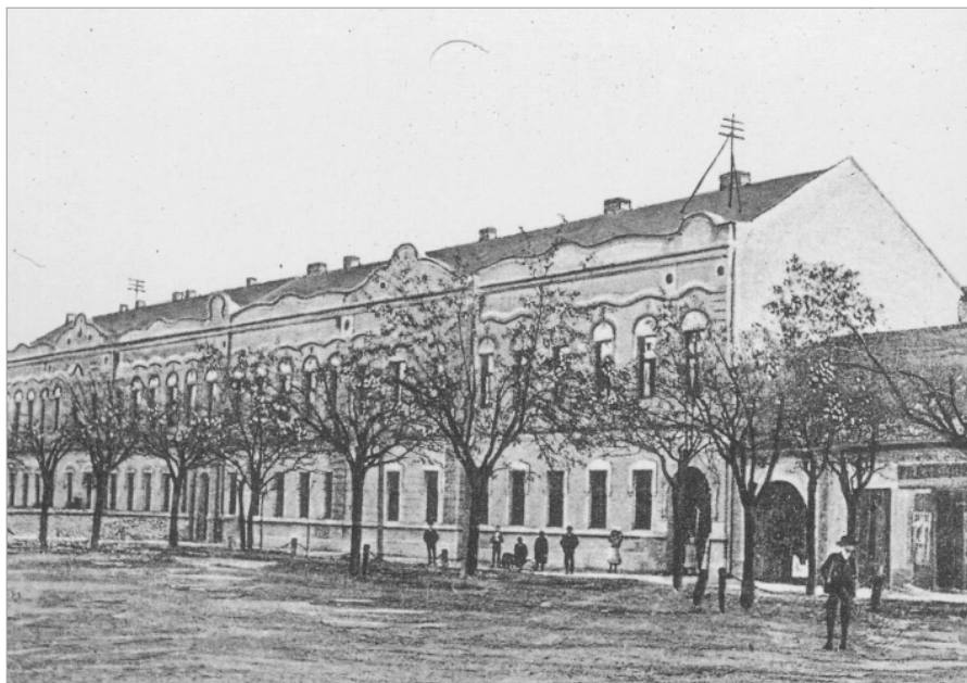
A Zentai Gimnázium épülete a 20. század elején, korabeli képeslapon

A zentai gimnáziumba 1898. július 5-én nyilvános pályázaton megválasztották rendes tanárrá, amit a Vallás- és Közoktatásügyi Minisztérium 1898. július 14-én jóvá is hagyott (SZŰCS 1899). Rendes tanárként évi 2400 osztrák–magyar korona fizetésért tanított. 2