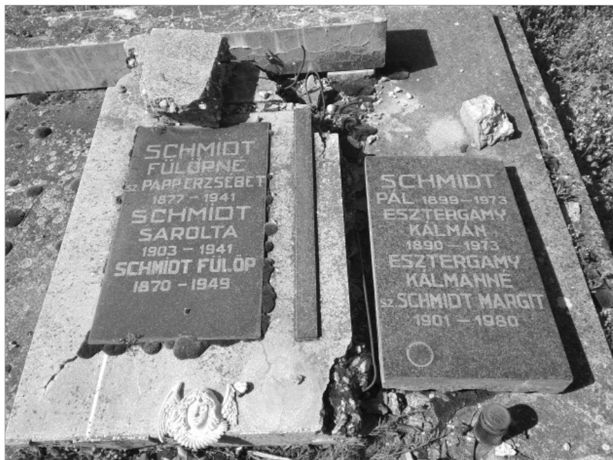
A Schmidt család síremléke a zentai Felsővárosi temetőben 2025 áprilisában

Ahhoz, hogy teljes képet kapjunk őseinkről, nem elég csupán – születési/keresztelési, házasságkötési és halotti anyakönyvek alapján – családfát felállí-