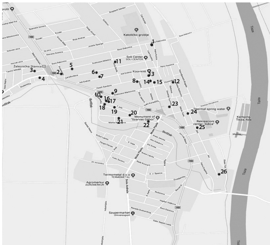
2. kép. A 2018-ban feltérképezett napsugaras házak bejelölt helye Ada műholdas térképén

az oromzat volt jobb állapotú. Júniusban két házat újrafényképeztem, egyik fotón a kontrasztot, egy másikon pedig az élességet módosítottam. Az összes fotóm tehát 2018 első feléhez köthető. A házak helyét Ada műholdas térképén számozott ponttal jelöltem (2.kép).