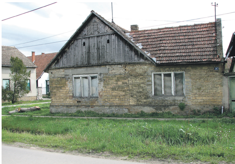
2. 1. kép.