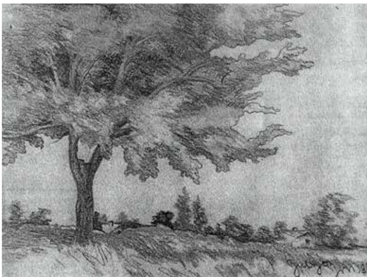
Gulyás József: A Cvíjő sor a nagy akácfa alól (ceruzarajz)