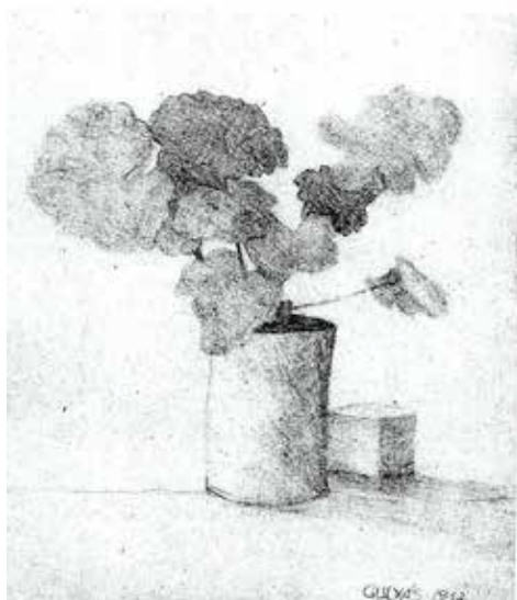
Gulyás József: Muskátli konzervdobozban (ceruzarajz)