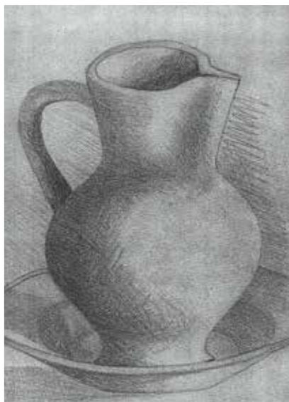
Gulyás József: Vizeskancsó (ceruzarajz)