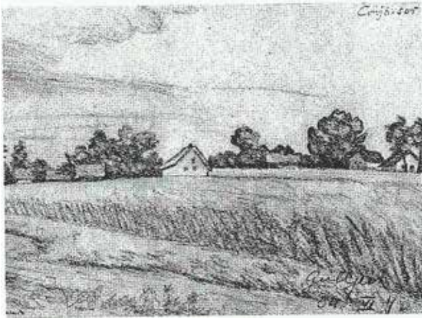
Gulyás József: A Cvíjő sor (ceruzarajz)