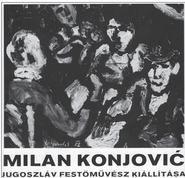
A műcsarnoki kiállítás katalógusa, 1971

nem sikerült lemosnia magáról, egészen addig a vádig, hogy azokban a nehéz, háborús időkben a szerb nemzeti érdekek árulója volt. Így alakult ki az – enyhén szólva – téves megítélés, de még közelebb kerülünk az igazsághoz, ha azt mondjuk, elvakult nézet miatt a festőművészt számos negatív megkülönböztetés érte.