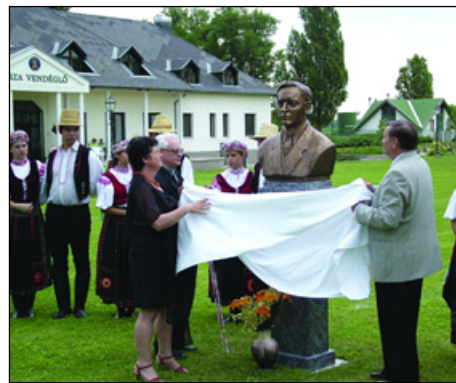
Klebelsberg szobor Lakitelken

– Amikor átnéztük a munkáiról készült fényképfelvételeket, közülük nagyon sokat ideadhatott volna a Szentbáromság szobortól kezdve