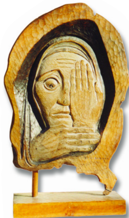
Rémület – diófa