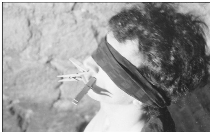
Hajas Tibor: Cím nélkül No. 11. (a II. Esztergomi Fotóbiennálé megnyitásakor). 1980. július 5.

A múzeum által kiadott katalógusban a műtárgyjegyzéken, bio- és bibliográfián kívül a kiállítást rendező Baksa-Soós Veronika bevezetője és Dékei Krisztina tanulmánya olvasható. A könyvet a Vető János által szerkesztett,