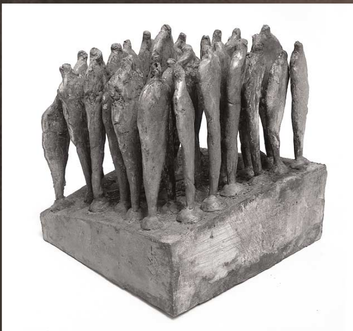
Bálint Zsombor: Alakok