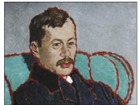
Petrovics Elek Rippl-Rónai József, Petrovics Elek és Meller Simon című festményén (részlet)