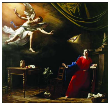
Angyali üdvözlés 2000, olaj, vászon 380x400 cm