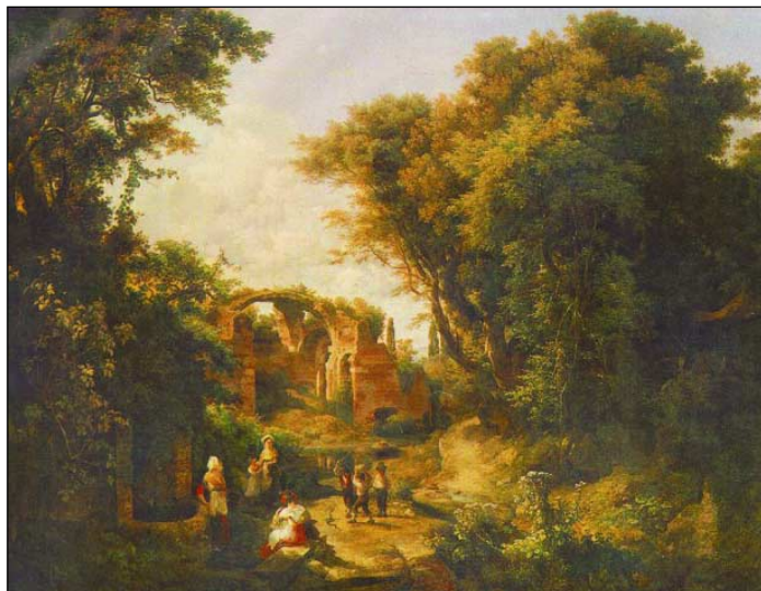
Asszonyok a kútnál, 1836, olaj, vászon, 63,5 x 84 cm magántulajdon

A KOGART Galéria id. Markó Károly és a magyar romantikus tájfestészet című kiállítása a XIX. századi tájbrázolás egyik fő vonulatát mutatja be. A kiállított 46 alkotás fele id. Markó Károly munkája, másik fele pedig fiai, tanítványai és ismert követői műve.