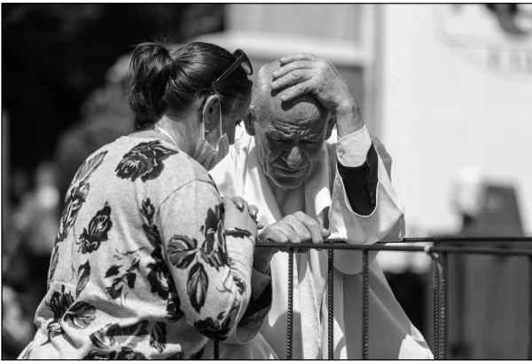
1. kép. Gyóntatás, 2021, Maszol, online: https://maszol.ro/fotoriport/A-lelket-kine-oltsatok-vandorbottal-a-kezukben-tizezrek-gyultek-ossze-a-csiksomlyoi-punkosdi-bucsun

Az elemzett fotókon megnyilvánuló értékek, eszmei tartalmak, illetve a kulturális szimbólumok hangsúlyozása által megteremtődnek azok a keretek, amelyek rendszerében a közvélemény a búcsúról gondolkodhat. Látható, hogy a tisztán vallásos jellegén túl milyen sokféle kontextusban lehet értelmezni az eseményt és a hozzá kötődő más ünnepeket. A búcsúnak az online újságok vizuális tartalmaiban és a befogadók felfogásában egyaránt jelen levő keretezési módjai , egymást kiegészítve alakíthatják a búcsú jövőbeli arculatát és változó jelenségeit.