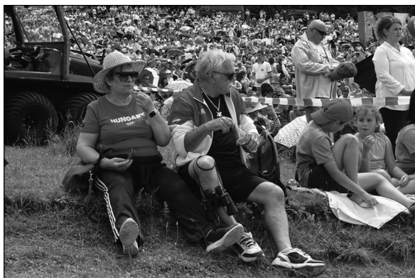
14. kép. Résztvevők portrészérű megjelenítése, 2022, Transtex, online: https://transtex.ro/kulfold/2022/06/06/csiksomlyoi-bucusu-punkosd-szekelyfold-erdely-romania-nyereg-kegyhely-csikszereda