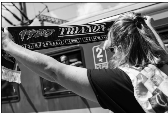
17. kép. A zarándokvonat utasa, 2022, Transtelex, online: https://transtelex.ro/életmod/2022/06/03/zarandokvonat-kolozsvar-csiksomlyoi-bucsu-tamasi-aron