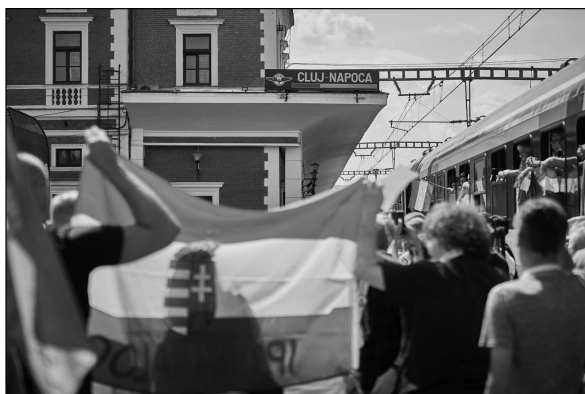
7. kép. A zárándokvonat fogadtatása a kolozsvári állomáson, 2023, Székelyhon, online: https://szekelyhon.ro/aktualis/az-elejetol-a-vegeig-n-kepekben-elmeselve-a-csiksomlyoi-bucsu