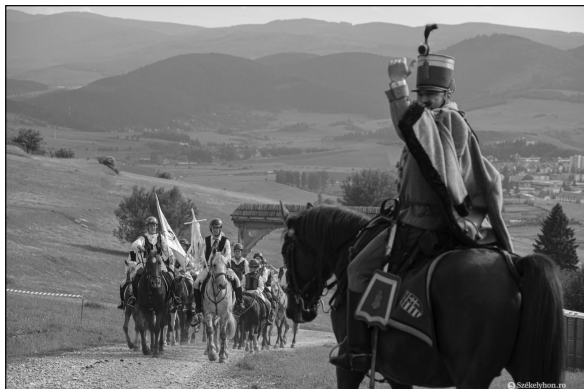
12. kép. Lovas zarándokok csoportja, 2022, Székelyhon, online: https://szekelyhon.ro/aktualis/unnepseggel-fogadtak-a-punkosdi-lovas-zarandokokat-a-csiksomlyoi-nyeregben