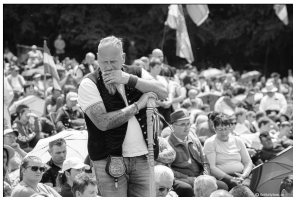
5. kép. Egy résztvevő portrészere megjelenítése, 2023. Székelyhon, online: https://szekelyhon.ro/aktualis/arcok-es-tekitetek-a-csiksomlyoi-bucsubol-ki-kit-ismer-fel