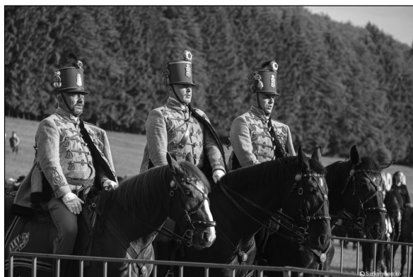
11. kép. Lovas zarándokok csoportja, 2022, Székelyhon, online: https://szekelyhon.ro/aktualis/unnepseggel-fogadtak-a-punkosdi-lovas-zarandokokat-a-csiksomlyoi-nyeregben