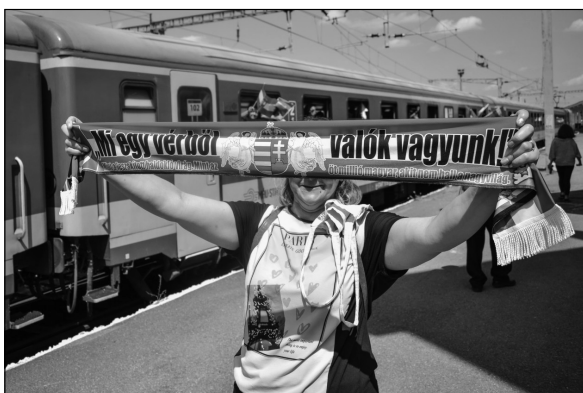
16. kép. A zarándokvonat utasa, 2022, Transtelex, online: https://transtelex.ro/életmod/2022/06/03/zarandokvonat-kolozsvar-csiksomlyoi-bucsu-tamasi-aron