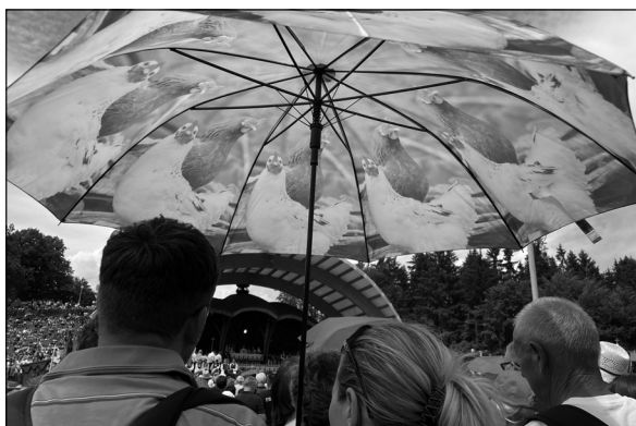
13. kép. A búcsún résztvevők megjelenítése sajátos tárgyaik környezetében, 2022, Transtex, online: https://transtex.ro/kulfold/2022/06/06/csiksomlyoi-bucusu-punkosd-szekelyfold-erdely-romania-nyereg-kegyhely-csikszereda