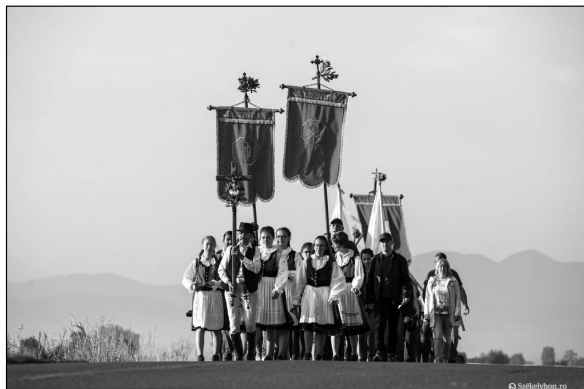
9. kép. Keresztalják zarándoklata, 2022, Székelyhon, online: https://szekelyhon.ro/aktualis/ahogy-a-jarvany-elott-gyalogosan-keresztaljakkal-csiksomlyora