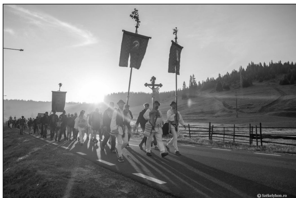
8. kép. Keresztalják zárándoklata, 2022