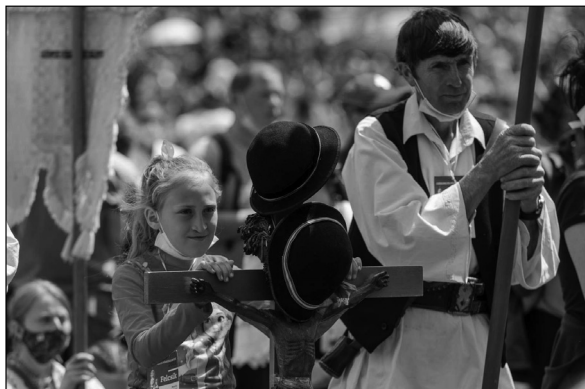
6. kép. Résztevők portrészerrű megjelenítései, 2021, Maszol, online: https://maszol.ro/fotoriport/A-lelket-ki-ne-oltsatok-vandorbottal-a-kezukben-tizezrek-gyultek-ossze-a-csiksomlyoi-punkosdi-bucsun