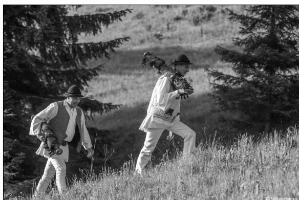
10. kép. Úton a Kis-Somlyó „nyergébe”, 2022, Székelyhon, online: https://szekelyhon.ro/aktualis/ahogy-a-jarvany-elott-gyalogosan-keresztaljakkal-csiksomlyora