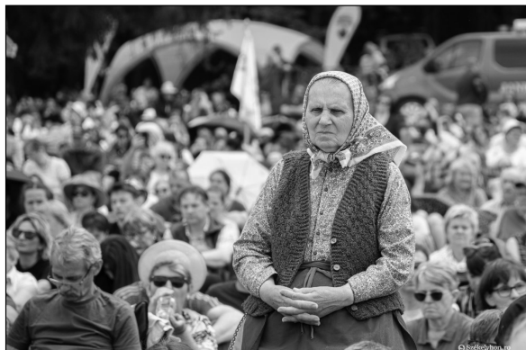
3. kép. Egy résztvevő portrészere megjelenítése, 2023, Székelyhon, online: https://szekelyhon.ro/aktualis/az-elejetol-a-vegeig-n-kepekben-elmeseve-a-csiksomlyoi-bucsu