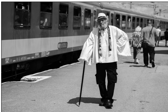
15. kép. A zarándokvonat utasa, 2022