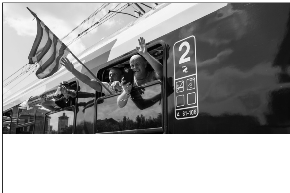
18. kép. A zarándokvonat utasainak csoportja, 2022, Transtelex, online: https://transtelex.ro/életmod/2022/06/03/zarandokvonat-kolozsvar-csiksomlyoi-bucusu-tamasi-aron