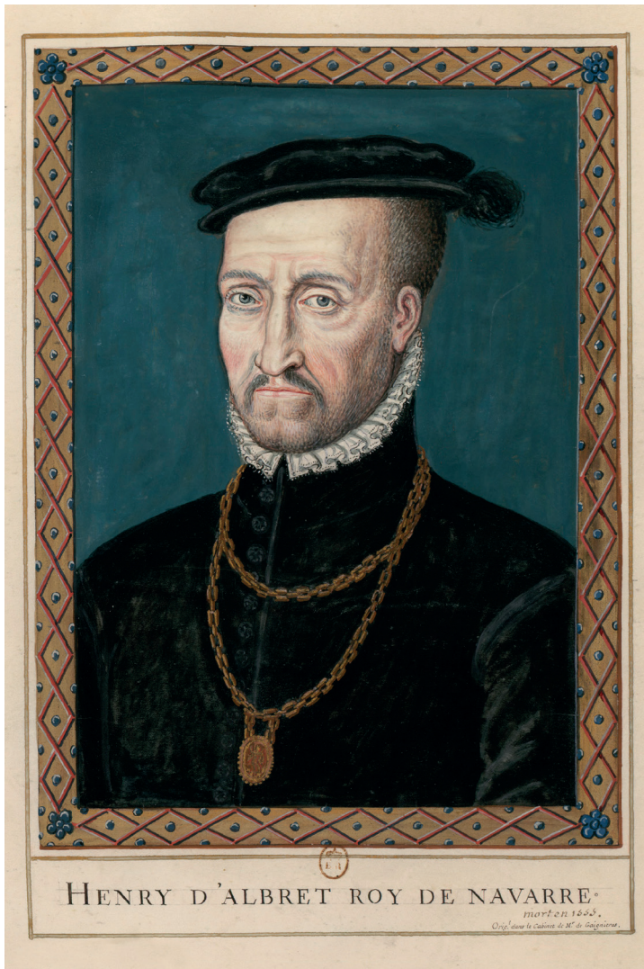
Henri d'Albret, Navarra királya