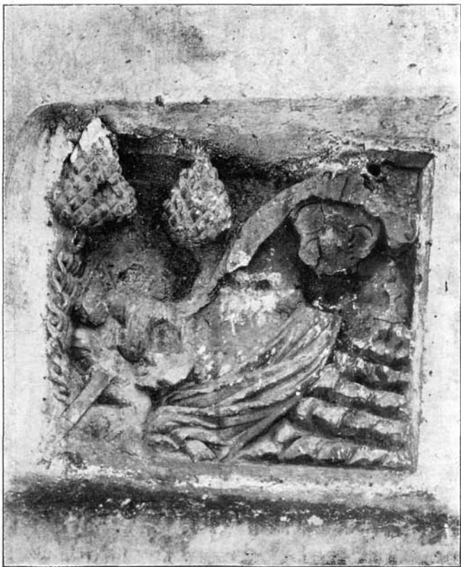
3. Krisztus az Olajfák hegyén Kolozsvár, Szt. Mihály-templom (1401).