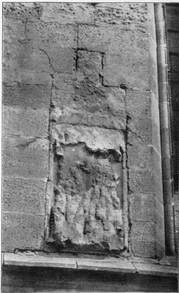
2. Krisztus az Olajfák hegyén Földvár (XV. sz. közepe).