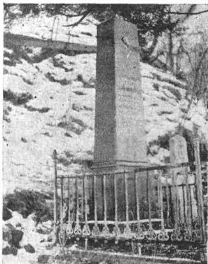
Zichy sírja Óradnán

A betegeskedésével kapcsolatos adatok élete utolsó 10 esztendejéből tűnnek elő tömegesebben. E szaka ragyogó példája a hanyatló test erősödő lelki emelkedettségének, a megbékülő lélek önfeláldozó tettkészségének. Mutatja az akaraterőt, amely az Isten szolgálattal és emberszeretettel gyakorlásával keresi az egyensúlyt a tett jó és az elkövetett hibák között.