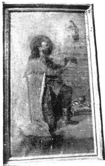
Szent István képe a majori gör. kat. templomban