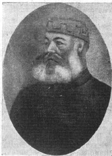
Zichy öreg korában