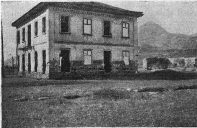
Zichy háza Majorban

Talajjavítás céljából megvételre jó trágyát kerestetett. Az ő rétje — mondotta — nagyon rossz és nem akarná, hogy az előző évi szénahiány megismétlődjék. Ezen csak trágyával lehet segíteni, mivel így a föld melegebb lesz, előbb hoz zsenge vetést. E műveletnek az őszi eső beállta előtt kell megtörténnie, mivel az a zsenge vetés egy részét évenként megrontja. Semmi úgy ki nem fizeti magát, — állította, — mint e rossz földeken való trágyázás. Elégedetten nézte, hogy a hideg az egyik évben jó jeget hozott, mivel így a trágya-kihordás könnyű lesz. A mély-szántásra vonatkozólag is maradt fenn intézkedése. Melegebb idő beálltával — rendelkezett — a burgonya-földet szántásuk fel vaskével, de igazán mélyen.