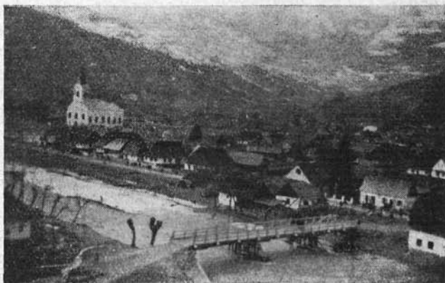
Major község a templommal

Építkezései, templomfelszerelései a püspököt a bőkezű patrónusok színvonalára emelték. Erdély több templommal lett gazdagabb az ő adakozása és műértő fáradozás révén. Az erkölcsi hatáson kívül, amely e templomokból kiárad, művészet, ízlés is sugárzik felénk ez alkotásokból, a magyar mágnás-püspök személyén keresztül érzékelhető szeretet átfogó erejével. A