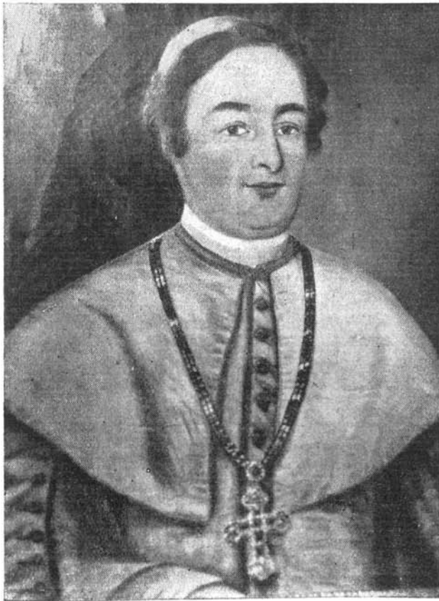
Gr. Zichy Domonkos veszprémi püspök korában

fordult. A szeretet magaslatán az embert nézte és mellétekintet nélkül megsegítette őket. Természetes, hogy jótettének áldásait elsősorban azok a szegények érezték, akik azokhoz a közelség miatt leginkább hozzájuthattak. Sehol feljegyzés, vagy emlékezet arról nincs, hogy nem látott volna mindenkit egyforma szeretettel. A kegyes főpap, egyben magyar főúr, nemes osztó mozdulata ez, az Údvözítő utánzása, amikor ez a csodás kenyérszaporításkor oszt tíznek, száznak, ezernek, ötezernek.