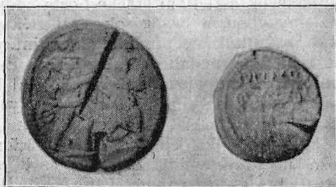
2. kép. Bevagdalt eredeti görög- (Aenea, Macedonia), és eredeti római consularis (Familia Pompeia) érmek.

A kronológiailag is eltérő két jelenséget szándékosan állítottuk egymás mellé. A két különböző területen más az érmek anyaga: ott arany, itt ezüst. Más a kor: ott a Kr. u. I. század, itt a Kr. e. IV—II. század. Más népfaj eszközi ott az aranyakon, itt az ezüstökön a bevágásokat. Abban azonban megegyezik a két terület, hogy mindkettő most, vagy a közelmúltban ismerkedett meg első ízben a tulajdonképeni pénz előnyeivel. Hill, a délindiai lelet első közlöje hiszi, hogy nem Rómában vagdalták be azokat, hanem Indiában. Regling nem olyan bizonyos ebben. Hill szerint a forga-