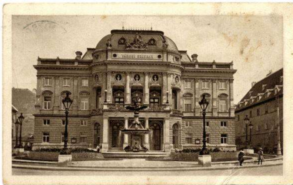
7. kép: Pozsony, Városi Színház.