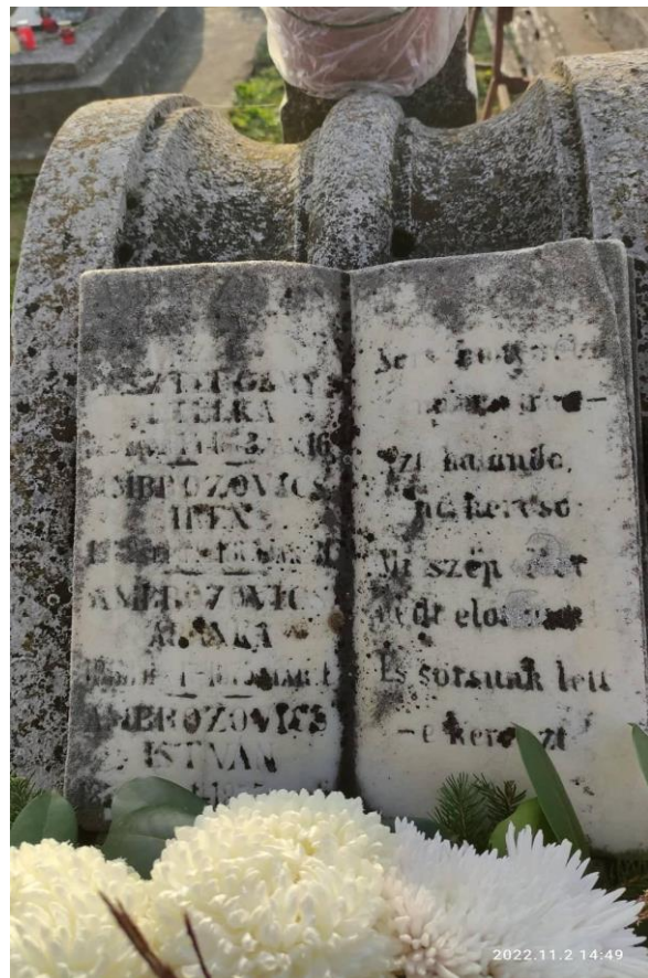
4. kép: Kopott felirat, mely a régmúlt időköt idézi