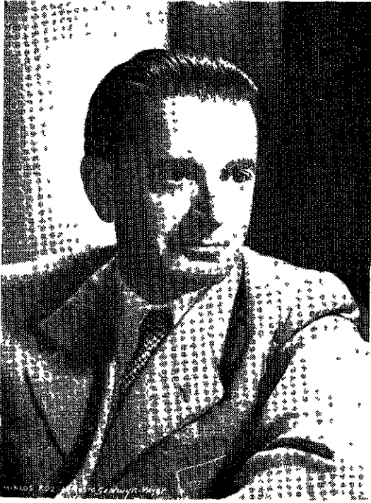
Rózsa Miklós harmadszor nyerte el a zenei Oscar díjat