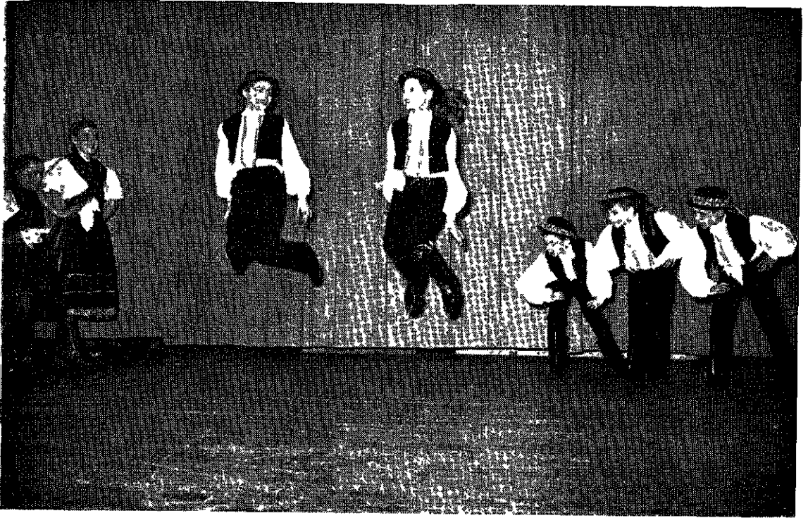
A táncsoport a március 15-i unnepeken a „Terenyei vetelkodo“-t adta elo