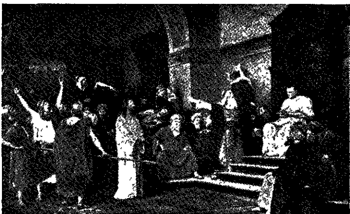
Munkácsy Mihály: Krisztus Pilátus előtt

„Dicsőséges volt a pályája és tagyogó lesz a hurnéve a magyar hazának s államférfinak. Hazájának küzdelme, hogy megtörje az osztrák despotizmus vaságját az egyik legnemesebb erőfe zítés volt, melyet elnyomott nép valaha is kifejtett, hogy elvesztett szabadságot helyreállítsa. Bajnoka és képviselője egy dicsőséges ügynek, az emberi szabadság ügyének.