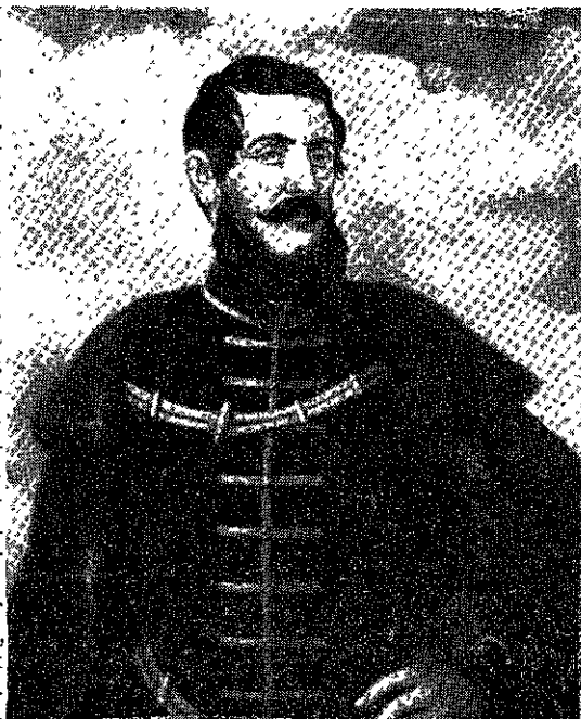
Kézi Kovács Elemér: KOSSUTH (A képet 1952. március 15-én avatta fel a Parasztszövetség a Magyar Nemzeti Bizottmány washingtoni épületében)

A szenátusban Smith (dem.), Ives (rep.) és Lehman (dem.) szenátorok méltatták Kossuthot és az évfordulót. "1848-ban — mondotta Smith — (52. III. 18.) a bátor magyar nép, Kossuth vezetésével felkelt az idegen zsarnokság ellen és elnyerte szabadságát és függetlenségét. Ez a szabadság azonban rövidéletű volt, és ma elérte nadirját a szovjet elnyomás következtében. A függetlenség szelleme azonban tovább él Magyarországon. Ez meglátszik azokból az egyre súlyosbódó büntetésekből is, amelyeket a vörös rezsim léptet életbe a kommunista zsarnokság elleni ellenállás megtörésére." Ives szenátor is szerencsekívánatait fejezte ki "a magyar függetlenségi nyilatkozatról való megemlékezés és a magyarok nagy vezetőjének, Kossuthnak szóló kegyelet megnyilvánulása" alkalmából,