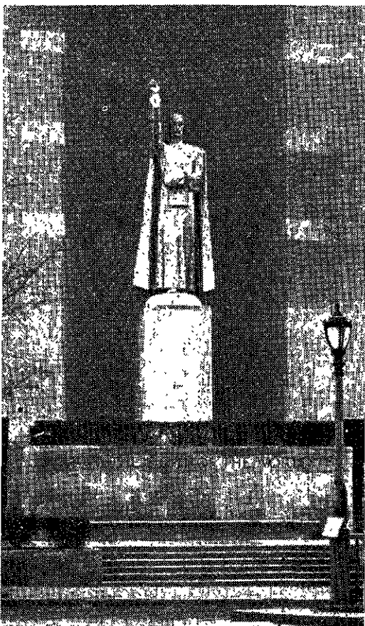
Körmendi monumentális műve: Én vagyok a világ világossága (I am the light of the world)

Körmendiék Amerikába érkeztek után, fokozottabb energiával folytatták munkásságukat, mintegy meghihetve a szabadság nagyszerű szellemétől, amely a világ legelső nemzetévé tette az amerikai népet és a kultúra védőbástyájává emelte az összes többi nemzetek fölé.