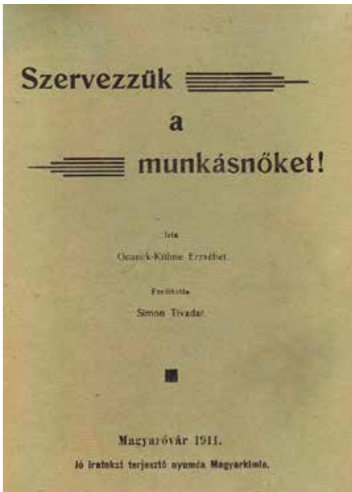
Magyarkimlei nyomdatermék – a győri Dr. Kovács Pál Könyvtár és Közösségi Tér gyűjteményéből