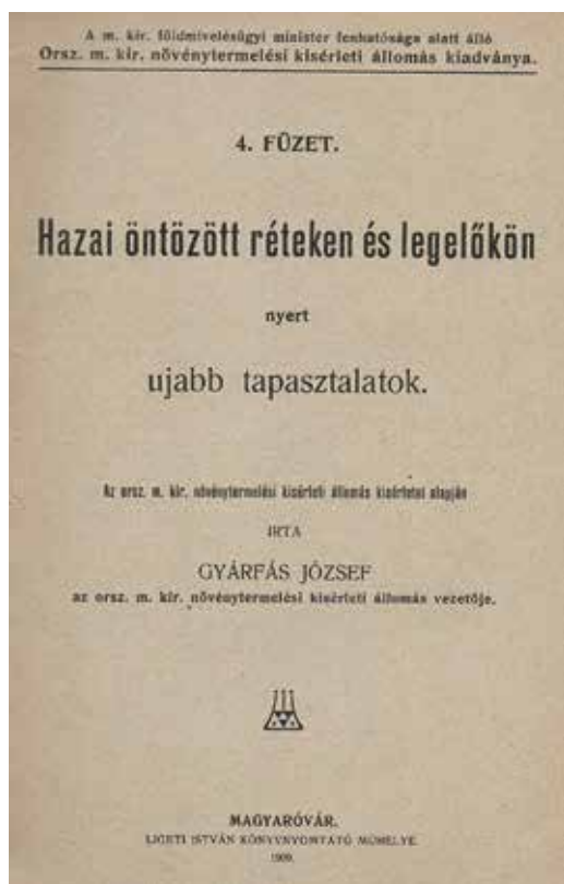
Ligeti István nyomtatványa

A több hajdani helyi nyomdát magába olvasztó, újságkiadásra is szakosodott mamutvállalkozás, A „Mosonvármegye” Könyvnyomdájából ötvenféle kiadványt találtunk a kezdő évből, 1910-től. Közülük 46-féle magyar, a többi német nyelvű. A magyar nyelvű nyomtatványokon belül húszféle szakkönyv. Alkalmi kiadványból kilencféle, közigazgatási műből, helyi iskolai értesítőtől és pénzügyi jelentésből három-háromféle lettünk. Két kiadvánnyal képviselteti magát az irodalom. Egy-egy nyomtat-