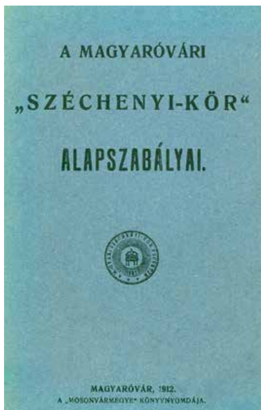
„Vármegyei” kiadvány – a mosonmagyaróvári Huszár Gál Városi Könyvtár gyűjteményéből