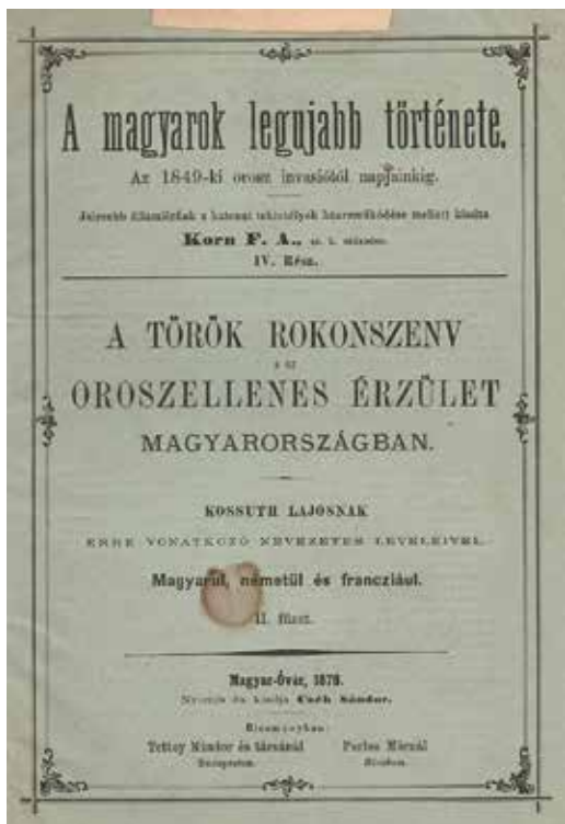
Czéh-Sándor nyomtatvány – a szerző gyűjteményéből

1908-ig a dunántúli evangélikus egyház könyveinek kizárólagos nyomtatója volt.