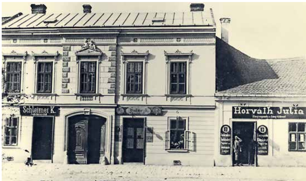
Jobbra a nezsideri főtéren működő nyomda

volt, majd 1910 körül már a főtéren működött. 1890-től 23-féle kiadványt találtunk. A 18-féle német nyelvű nyomtatvány közül nyolcféle kalendárium, hétféle vallási mű, kettő emlékkiadvány, egy pedig helyi földrajzi munka. A fennmaradó öt magyar nyelvű mű közül kettő alkalmi kiadvány, egyféle tankönyv két kiadása, egy helyi szervezeti pénzügyi jelentés és egy szervezeti alapszabály.