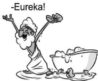
2. ábra. Archimedes kreativitása – az Ő szempontjából a fürdésnek nem volt célja a kreativitás

A tömegvonzás törvényének megtalálása hasonló az Archimedesnél látott kreativitáshoz: bárhogyan is történt Newton és az alma esete, a tömegvonzás törvényének az ötletét az alma lepottyanása adhatta. Ha ezt a HEURÉKÁ-t egy AI folyamatrendszerrel kívánnánk megol-