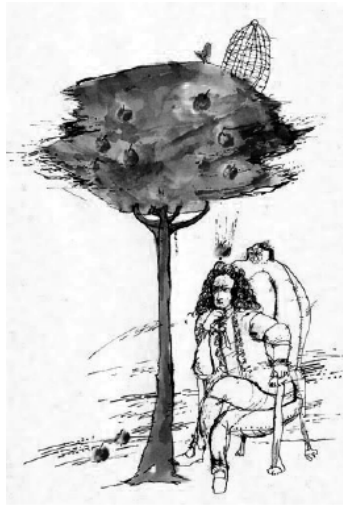
3. ábra. Newton: nem azért mentem az almafa alá, hogy rájöjjenek a tömegvonzás törvényére