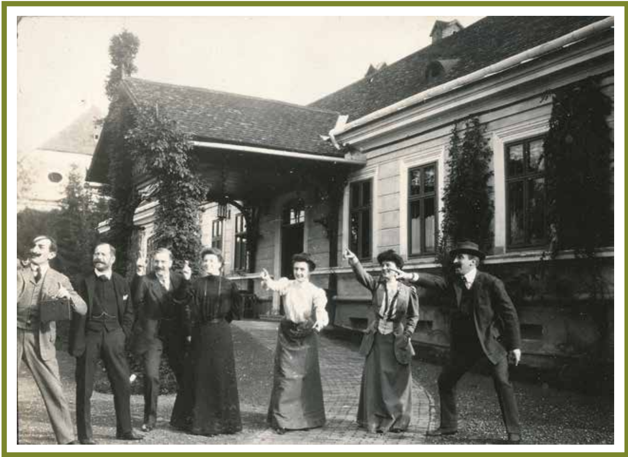
Széchényi Viktor családi fotóalbumából – Csokonya, 1906. november (OSZK Kézirattár)

elismeréssel, a Fekete Sas renddel tüntette ki. Fiatal korától kezdve szenvedélye volt a muzsika, zongorázott és komponált. Művei ismertek voltak a kortársak előtt, társasági összejöveteleken gyakran játszották darabjait. Jó barátságban volt többek között Johann Strausszal és Liszt Ferencsel is. Főként dalokat és táncokat szerzett, polka-mazurkája például része volt azon műveknek, amelyeket Ferenc József császár és Erzsébet hercegnő esküvőjére ajándékoztak. A tárlaton elsősorban az általa szerzett zeneművek kottái voltak megtekinthetők.