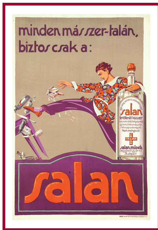
Faragó Géza: Salan: Fertőtlenítő házi/zeneszer. Litográfia, 63 x 95 cm. Weiss, Budapest, 1928. (OSZK Plakát- és Kisnyomtatványtár, PKG 1928/132)

A feldolgozó munka új fejezetét jelentette az, hogy megjelentek a könyvtári on-line katalógusok és adatbázisok. Az OSZK egyes különgyűjteményi téraiban a munkatársak az ún. AMICUS rendszerben próbálják