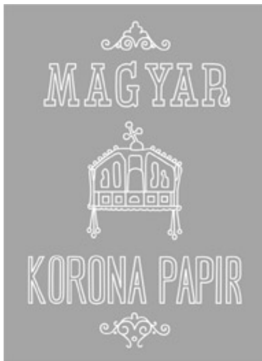
2. ábra. MAGYAR KORONA PAPIR vízjel 1893-ból