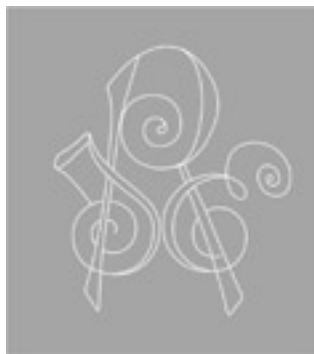
4. ábra. Riegler kalligrfikus monogramm vízjele

Az 1894–1939 közötti időszakban több mint 18 változatban voltak forgalomban az ADRIA