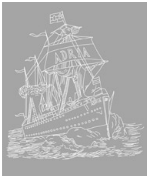
3. ábra. Az ADRIA vízjel 1895-ből

növényi motívumainak stilizált indáit (2. ábra). A Magyar Korona Papír a nagyobb grammsúlyú meghívó és levélpapírok kedvelt vízjele volt.