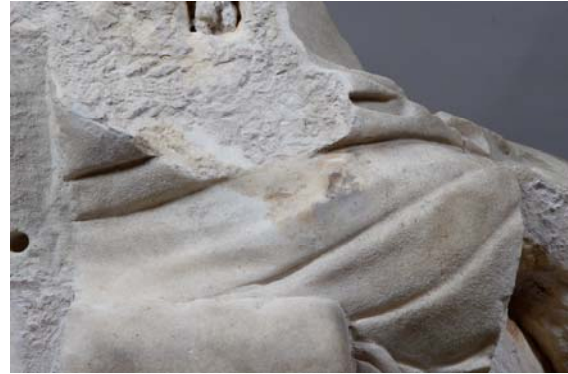
4. ábra: „Enyedi Iuno” – a bal oldalon a zsámoly fölötti faragott felület a jobb vállkiegészítés eltávolítása után (Mátyus László felvétele)

Az arc idealizált nőalaké, ami istennő ábrázolására utal. A fej a testhez képest aránytalanul kisméretűnek látszik, de makroszkópos megjelenése alapján úgy tűnt, hogy a testtel megegyező márványból készült, tehát eredetileg is összetartozhattak. A fej ókori kőfaragó-technika szerint csatlakozik a testhez: külön faragták ki, és a vállak között kialakított üregbe illesztették ( 5. ábra ). A ma látható állapota azonban nyilvánvalóan újkori restaurálás eredménye: a nyakat ugyanis külön darabból – a jobb vállkiegészítéshez hasonló szürke ezeztű márványból – faragták ki, majd a fejet kissé előre döntve illesztették a nyaki üregbe ( 6. ábra ).