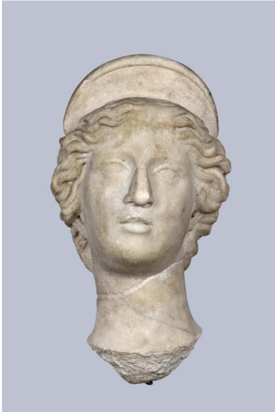
9. ábra: „Enyedi Iuno” – a fej a különálló nyakrésszel és a bronzcsappal

Fig. 9.: „Juno Enyedi” – the head, the separated neckpiece and the bronze peg