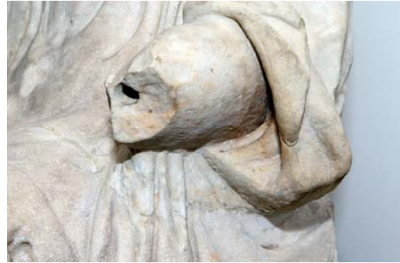
10. ábra: „Enyedi Iuno” – a bal karkiegészítés

A fej rögzítése más technikával történt: az aljából hosszú bronzcsap lóg ki, amely átvezet a különálló nyakrészen ( 9. ábra ), és a test nyakrészén lévő kerek vájatba illeszkedik ( 5. ábra ). A bronzcsap használata és a fej rögzítése – mint szó volt róla – megfelel az ókori gyakorlatnak. A fej esetében az anyagvizsgálat eredménye különösen érdekes volt, mivel makroszkópos szemrevételezés alapján a szobor és a fej anyaga megegyezőnek tűnik, bár a különálló nyakrész és a kissé előredőlő fej egyértelműen jelzi, hogy a fejet a szobor most látható állapotában nem az ókorban illesztették a helyére.