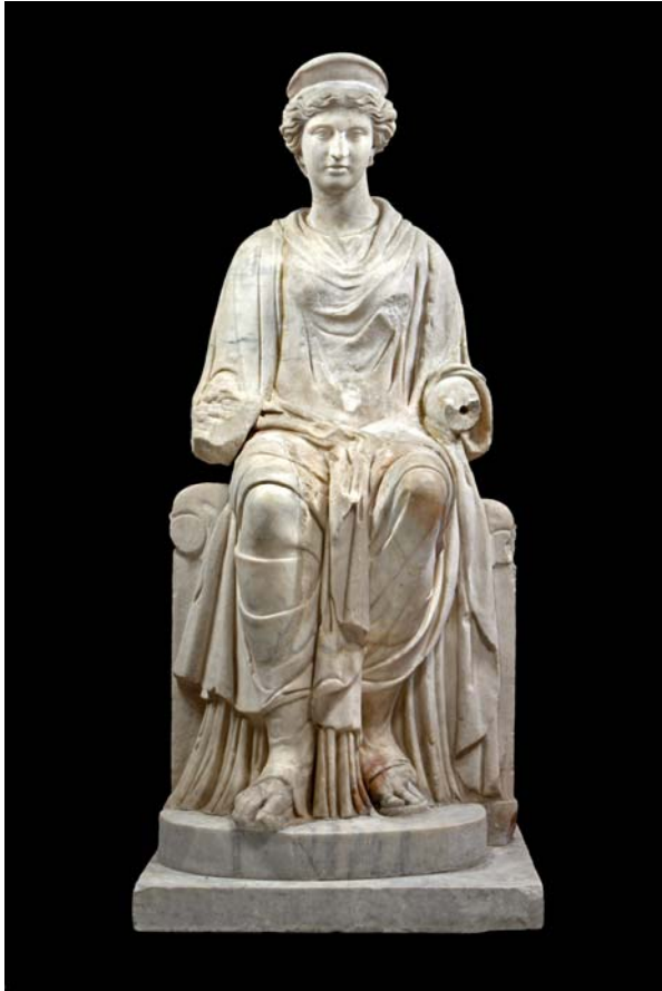
1. ábra: „Enyedi Iuno” – előnézet

Fig. 1.: „Juno Enyedi” – frontal view