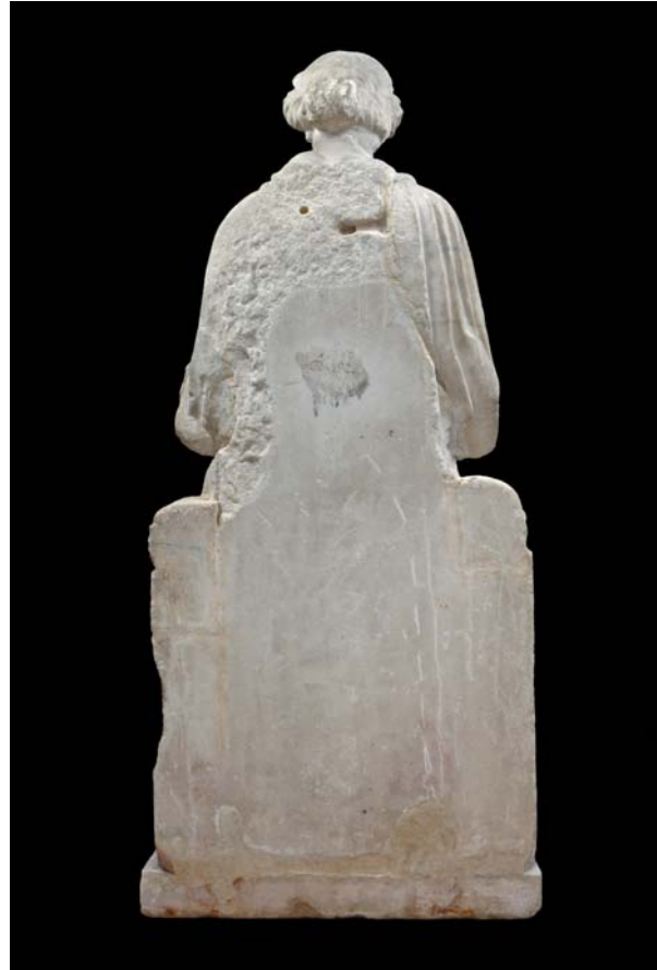
2. ábra: „Enyedi Iuno” – hátnézet

Fig. 1.: „Juno Enyedi” – frontal view