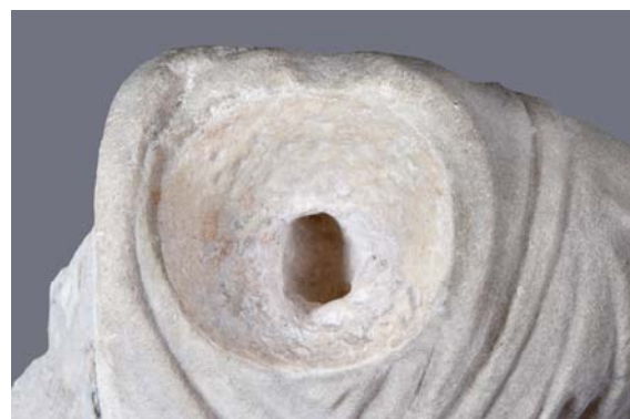
5. ábra: „Enyedi Iuno” – a vállak közötti üreg, amelybe a külön megfaragott fejet illesztették

A szobor ábrázolásának meghatározása és a keltezés rendkívül nehéz feladat, lehetőségeit Goette (2008) foglalta össze. Ha az alak valóban magas támlájú trónuson ült, és eredetileg is idealizált vonásokat mutató fej tartozott hozzá, akkor a szobor istennőt ábrázolhatott. A trónus anyaistennők, például Iuno vagy Démétér ábrázolásánál szokásos, de a császárkorban elterjedt perszónifikációk (például Fecunditas , a Termékenység) esetében is megjelenhet. Közlelbi meghatározás az attribútumok hiánya miatt nem lehetséges. A készítés korát csak hozzávetőlegesen, főleg a faragás stílusa alapján lehet meghatározni. A köpeny kis redői nyújtanak ehhez támpontot, valamint az, hogy ritkán fordulnak elő mély, fúróval vájt hornyok. Ezek alapján az „Enyedi Iuno” a Kr. u. 2. század első évtizedeiben készülhetett.