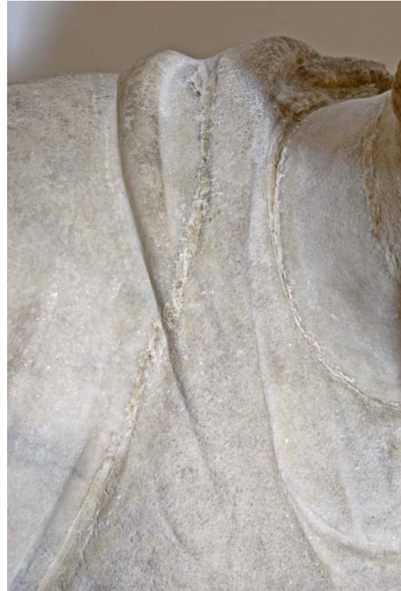
12. ábra: „Enyedi Iuno” – a jobb vállkiegészítés felső része

A ma látható műtárgy azonban egy következő restaurálási fázis eredménye. Feltehetően az első restaurálás során visszaillesztett jobb kar újra megsérült, ezért most újjal pótolták. Az új kiegészítés az alsó részen egyáltalán nem illeszkedik a szoborhoz, eltakarja a ruhadedőket ( 11. ábra ), és a szoborhoz képest túlméretezett ( 1. ábra ). Ez elvben utalhatna arra, hogy egy szobortöredék újrafelhasználásáról van szó, de a nyaknál lévő ruhadedő pontos átmenete a kiegészítés és a test között azt jelzi ( 12. ábra ), hogy a kiegészítés mégis ehhez a szoborhoz készült, csak rendkívül hanyag munka.