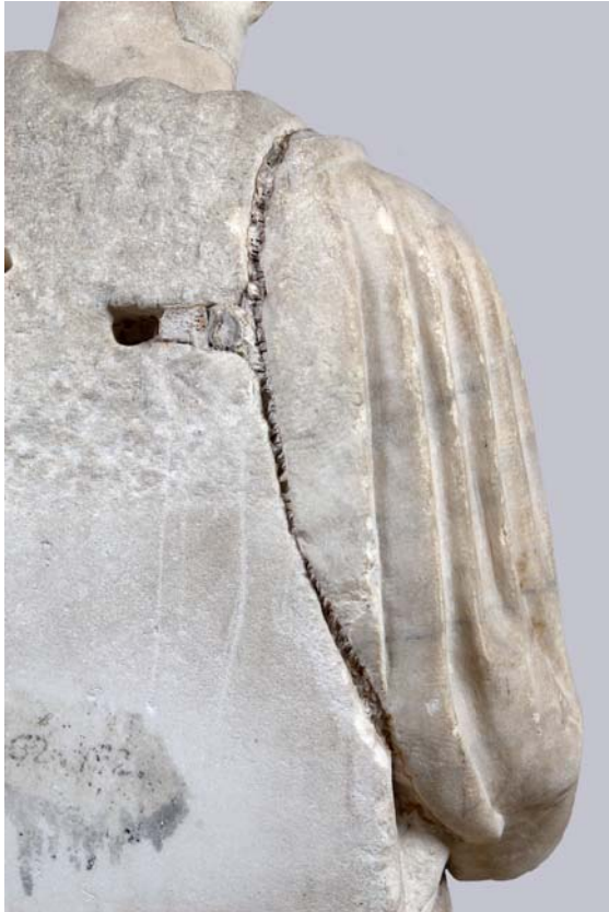
3. ábra: „Enyedi Iuno” – egy kapocs nyoma a szobor hátulján, amely egy korábbi jobb vállkiegészítést rögzíthetett

Fig. 3.: „Juno Enyedi” – mark made by a peg on the back of the figure, which might have fastened an earlier right shoulder extension to the body