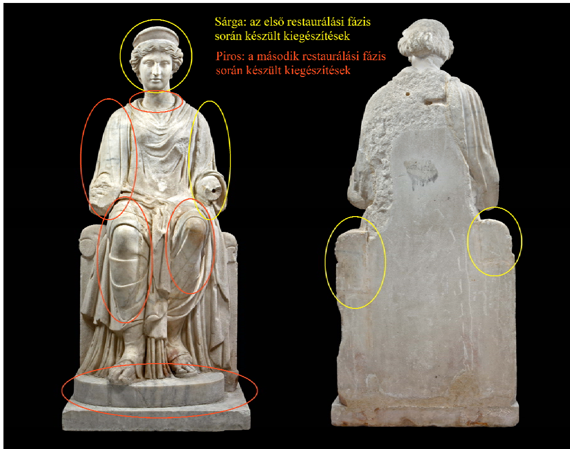
13. ábra: Az „Enyedi Iuno” restaurálási fázisai