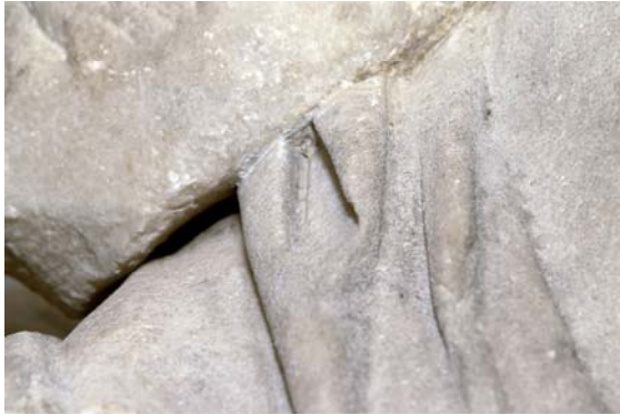
11. ábra: „Enyedi Iuno” – a jobb vállkiegészítés alsó része

Fig. 11.: „Juno Enyedi” – lower part of the right shoulder extension