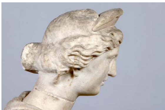
6. ábra: „Enyedi Iuno” – a fej oldalnézetben