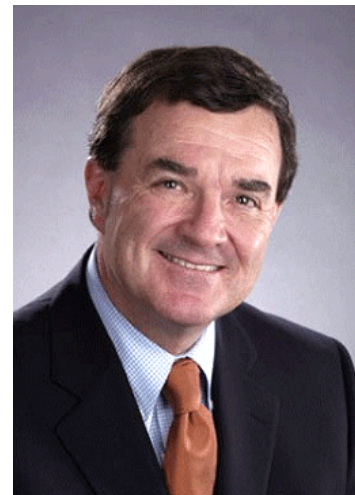
James Flaherty

A kanadai költségvetés idej többlete eléri a 13,2 milliárd dollárt, jelentette be James Flaherty, a konzervatív kormány pénzügyminisztere. A pénzügyminiszter azt is jelezte, hogy a teljes összeget az ország adósságának visszafizetésére fordítja a kormány. Ezzel együtt azt is bejelentették a parlamentben szeptember 25-én, hogy 2 milliárd dollár értékű elvonásokat terveznek. Például négy millió dollárt vonnak el a kendermag körüli kutatásoktól és öt milliót a kanadai nők státuszát tanulmányozó szervezetektől. Amiután a kormány befizeti a 13,2 milliárd dollárt, az ország adóssága összesen 481,5 milliárd dollár lesz. „Többet kell tennünk. Kormányunk adókat akar csökkenteni és számos választási ígéretet kell még valóra váltanunk”—mondta Flaherty. A kanadai adófizetők szövetsége jelezte, hogy szerinte még mindig túl sok adót fizetnek a kanadaiak és ezzel magyarázható az óriási többlet.