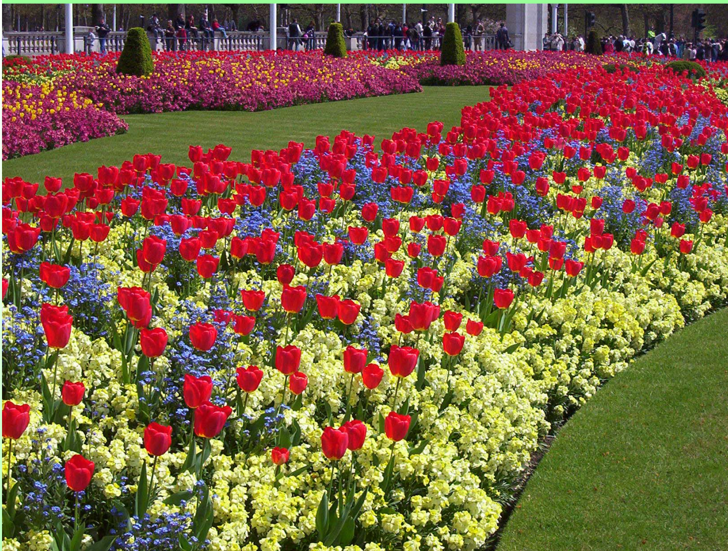
A BUCKINGHAM PALOTA ELŐTT —A Buckingham Palota előtt piros tulipánok virítottak április utolsó vasárnapján.