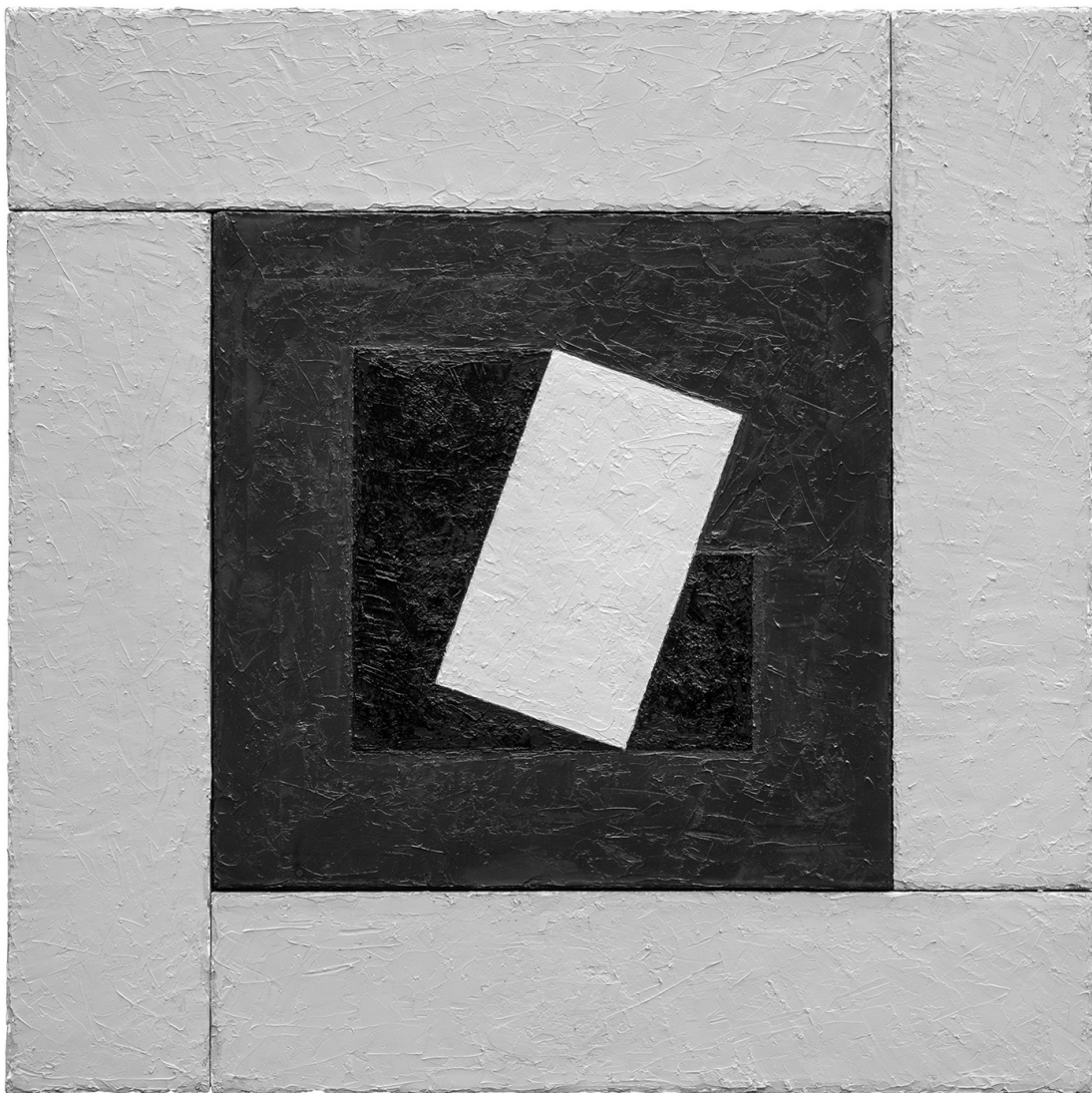
BEREZNAI PÉTER_BILLENŐ HOLD, 2022. olaj, vászon, 80×80 cm