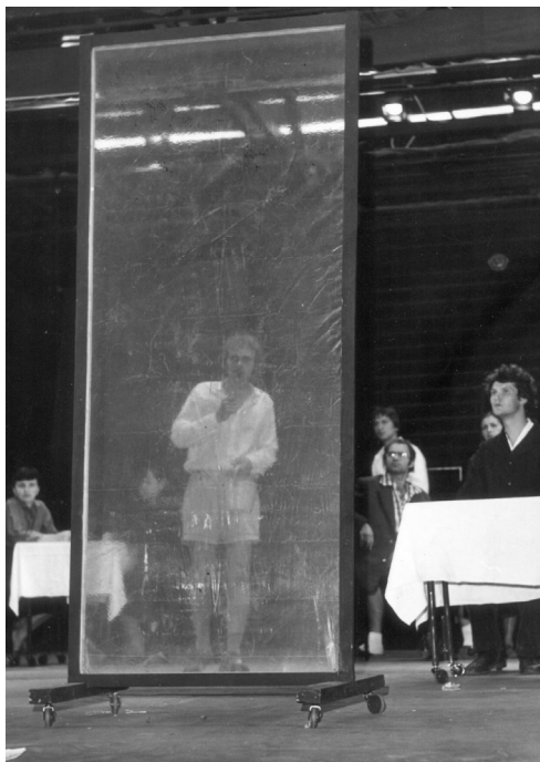
Pisti sarlót és kalapácsot fest a kávéház kirakatára ( Pisti a vérzivatarban , Pécsi Nyitott Színpad, 1980)

kívüli figura, aki befolyásolja a történéseket. Mindenekelőtt ilyen Rizi a Pistiben , a Postás a Tótékban és Bolyongó a Kulcskeresőkben .