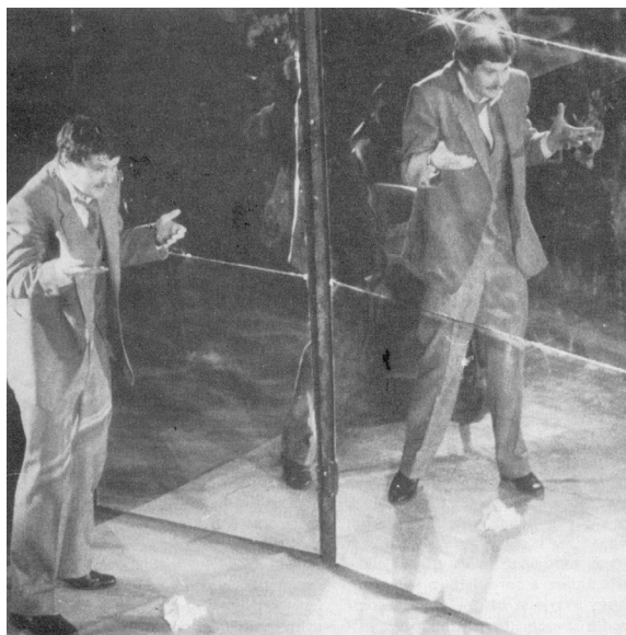
Barabás a tükrök labirintusában ( Forgatókönyv , Pécsi Nyitott Színpad, 1984)

A Kulcskeresők értelmezésének újdonsága a térhasználatban fogható meg leginkább, ugyanis a nézőknek Fórisék lakásának ajtaján kellett bemenniük a nézőtérre, ami tulajdonképpen a lakás részét képezte, tehát a közönség ugyanúgy foglya lett a befelé nyíló, de kifelé zárt ajtónak, mint a szereplők. A Forgatókönyv ben is jelentést hordozott a tér, a cirkuszi manézsz, amelyet körbeültek a nézők. A tér egyes szegmensét tükröfalakkal tettek láthatóvá, és egyes jelenetekben (mindenekelőtt a Rajk Lászlóról mintázott Barabás és a manipulátor-illuzionista vallató, a Mester közötti epizódban) e tükrök segítségével sokszorozták meg a szereplők képét. Felerősítették a darab dramaturgiai jellegzetességét, a monológszerkezetet, ami a párbeszédés átkötő epizódok ritkításával járt, és beillesztették a szövegbe a Pisti tárgyalás-jelenetét. Az előadás végén Fellini 8 és 1/2 című filmjének zárózenéje szólalt meg hegedűn. Nino Rota zenéje és a zárókép kitérte a manézst és felidézte Karinthy Frigyes írását, a Cirkuszt is.