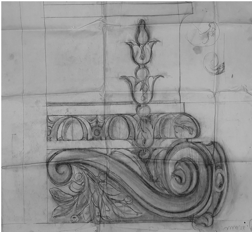
Voluta tulipános ornamenssel, papír, ceruza, 107×86 cm, MNL CSML, XV.2.b. 45/44.

Mikor Babits a Nyugat harmadik nemzedékének költőit bírálva a fiatal Weöres Sándorról megjegyezte, hogy tőle „még kiszámíthatatlan meglepetéseket várhatunk,” nem lehetett sejtteni, hogy jóslata beigazolódik. A 2019-ben megjelent A macska visszatér, A denevér vére, A visszaforgatott idő című legújabb köteteket olvasva – Babits szavaival – bátran kijelenthetjük, hogy Petőcz Andrásról „még kiszámíthatatlan meglepetéseket várhatunk”!