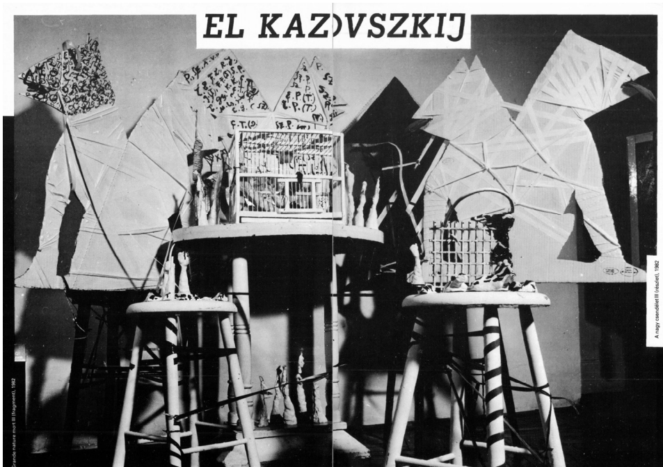
El Kazovszkij: A nagy csendélet III. (részlet), 1982 – a Múcsarnok katalógusában szereplő reprodukción az installáció egykorú állapota szemlélhető

El Kazovszkij Bowie-installációját 1982-ben a Párizsi Biennáléra, a fiatal művészek csoportos nemzetközi bemutatkozására rakta össze (1982. október 1. – november 17.), majd 1983-ban a Múcsarnokban is bemutatta (1983. február 11. – március 20. Banga Ferenc, El Kazovszkij, Záborszky Gábor. Magyarok a 12. Párizsi Biennálén. Rend. Frank János). A katalógus bevezetőjében Németh Lajos érzékenyen megvilágítja a még kanonizálatlan installáció műfajának közegét, értelmezési lehetőségeit, amelyet éppen Kazovszkij munkásságában, munkásságán keresztül szemlél és határoz meg: „Jellegzetes »köztes« műfaj az installáció, egy művilég elhatárolt tér művészi birtokbavétele... a szubjektíve motivált, az egyéni mitológia által jelentéssel felruházott tárgy-együttesek asszociatív-plasztikai rendbe szervezése... a »helynek« egyszerre képzeletbeli és materiális »berendezése«, mikor is a többé-kevésbé zárt terület totalitássá válik.” 17 A mai napig változásban lévő installáció kiválóan megmutatja, hogy El Kazovszkij milyen mélyen ráérezett a Bowie-féle sztárépítő-jelenség lényegére. A Kelet-Európából jött fiatal művész egyértelműen ki akarta fejezni a nyugat-európai trendekben való jártasságát 18 azzal, hogy a tudatosan, de mégis már fel-felhasználta, a párizsi kiállításon