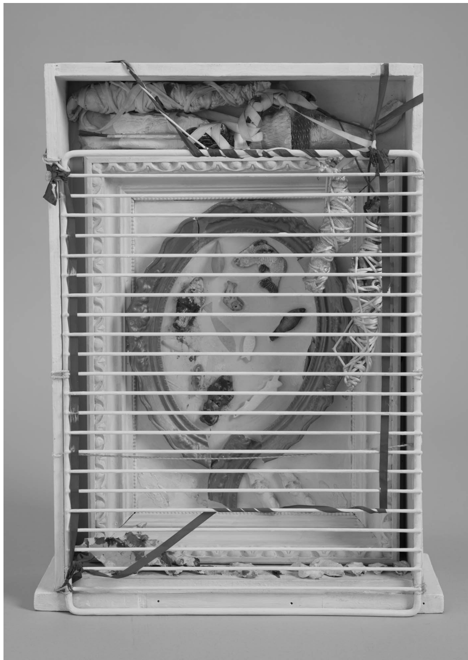
Fehér csendélet , 1981, Fa, fém, műanyag, textil szalag; tárgykollázs 55 × 37 × 11 cm, El Kazovszkij hagyatéka