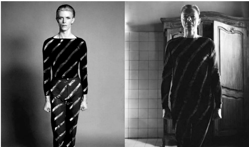
David Bowie egy 1970-es évekbeli fotón és a Lazarus című dalhoz készített klip egy jelenetében

Hasonló scenírozás figyelhető meg a Lazarusban is; az ágyban fekvő, haldokló, lekötött szemű figura saját haldoklását viszi színre, amikor egyszer csak (1:58-nál) a dráma átvált feszesebb ritmusra, és a bohém fiataikor elevenedik meg. A haldokló ágya melletti szekrényből kilép az idős David Bowie ugyanolyan csíkos ruhában, melyet fiatalon viselt, és mosolyogva, táncolva mesél fiatakoráról. Közben a lekötött szemű figura azt énekl, hogy „oh, I’ll be free /Just like that bluebird” – a boldogság kék madarának romantikus motívumára utalva.