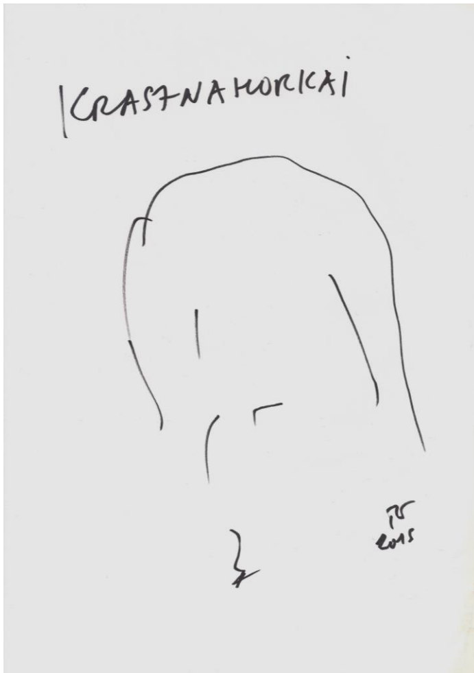
KRASZNAHORKAI (fekete filctoll, A/4 papír, 2015)

barthes-i nyelvi forradalom. Habár túlzás lenne azt állítani, hogy Láng Zsolt új regényével paradigmaváltás történt volna, azonban egy biztos: a művészet alkimista, transzgresszív erejével nemcsak egy halott (valós vagy valótlan) Bolyai támadt fel, hanem a régiből, a múltból építkezve valami izgalmas, a tragédiákkal, pusztulásokkal szemben is pozitív, reménykeltő világ keletkezett. Némi csillagpor.