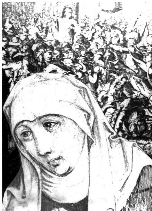
...Gondoljunk Kumria rác apácára (Anno)