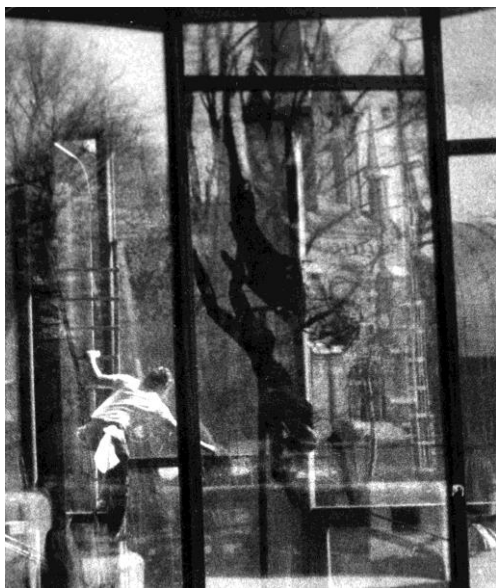
...Szerintem elég annyi, hogy – Isten hozta nálunk!