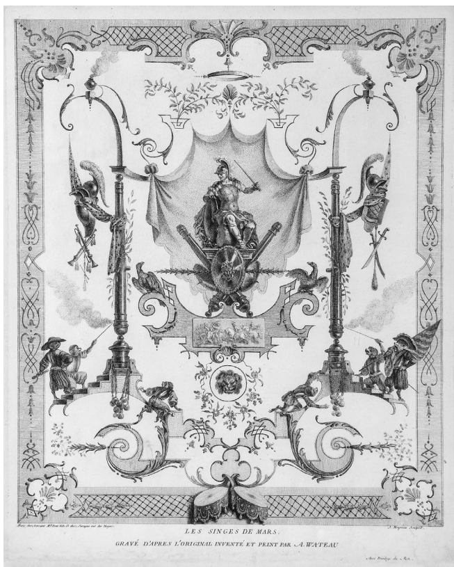
Jean Moyreau metszete Jean-Antoine Watteau után, Mars majmai [Les Singes de Mars], 1729, Chicago, Art Institute

Ez az arabeszk egyszermind singerie , azaz az emberi viselkedésformákat parodizáló majomábrázolás is, amely a XV. Lajos korának francia ízlését meghatározó chinoiserie -k (kínai díszítőmotívumok) mellett ugyancsak az egzotizmus elterjedéséhez kötődik. 17 A XVIII. századi francia arabeszekben egyszerre látható több, különálló jelenet, amelyek egyetlen központi téma köré csoportosulnak: a Mars majmain ez a háború témája. A XXI. századi néző a figuratív képeket óhatatlanul értelmezni próbálja, elmesélhető történetet keres rajtuk. Bár az arabeszk széttagoló, különválasztó stratégiája miatt ez a kompozíció nehezen „olvasható”, első ránézésre szembetűnik a harci szekéren trónoló római hadistent körülvevő, emberi ruhát