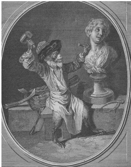
LA SCULPTURE. Ce singe industrieux qui travaille en sculpture Peut de l'Art qu'il exerce entre dît l'Écrivain. On ne peut être bon sculpteur Qu'en se faisant singe de la Nature. (Réduction de la gravure de Desplaces, d'après le tableau d'Antoine Watteau.) — (Musée d'Orléans.)

lettát tart a kezében, másikuk rajzol. Kevésbé valószínű, hogy ez a kép Watteau festő majmának felelne meg, ám az a tény, hogy Dubois de Saint-Gelais Watteau kapcsán Bruegel nevét említi, a francia festő majomábrázolásának flamand gyökereire utal. Szintén sokatmondó, hogy egy másik XVIII. századi forrásszöveg, a kertművészettel is foglalkozó kritikus, Dezallier d'Argenville 1749-ben megjelent Voyage pittoresque de Paris [Párizsban tett festői utazás] című írása – amely a francia főváros jelentősebb műkincseit mutatja be – a Palais Royal flamand gyűjteményét alkotó festmények felsorolásakor Bruegel képei szomszédságában említi Watteau Festő majmait . 22 Vajon Watteau-nak létezett még egy képe, amelyen szintén festő majmokat ábrázolt? Vagy téves attribúcióról lehet szó, és a két idézett szerző valamely más flamand festő művét tulajdonítja neki? Valószínűleg ez utóbbi feltételezés a helytálló, hiszen a Watteau festményeiről – barátja, a műkedvelő mecénás, Jean de Julienne jóvoltából – készült, két kötetben kiadott rézmetszet-sorozat alapján a művész időközben elveszett képei viszonylag jól beazonosíthatók, ám a Julienne-gyűjteményben nem szerepel többalakos majom-kompozíció.