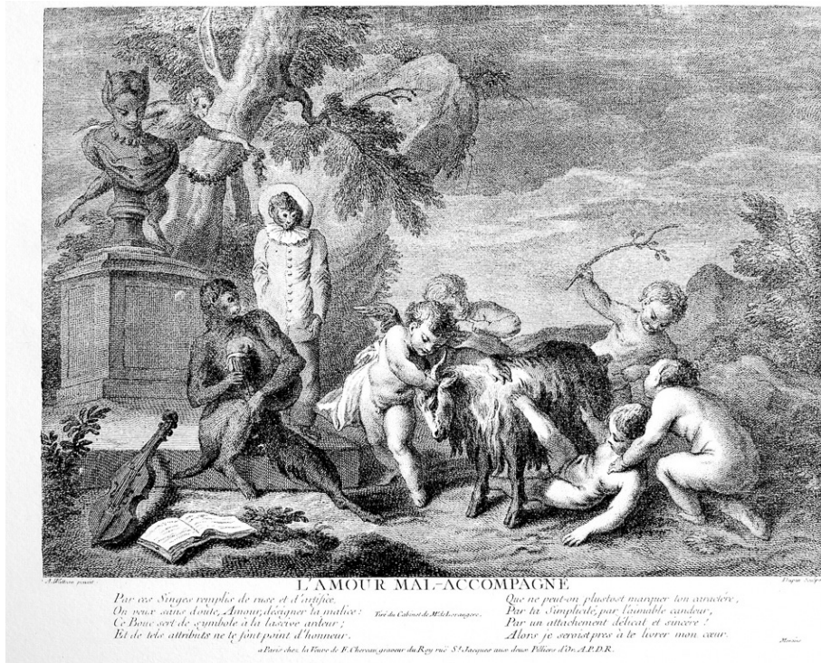
Pierre Dupin metsze Jean-Antoine Watteau után, Szerelem, hamis kísérettel [L'Amour mal accompagné], 1744 előtt, Paris, Bibliothèque Nationale de France, Cabinet des Estampes

A Szerelem, hamis kísérettel című képen a legszembeötlőbb és ugyanakkor a legkülönösebb a majmok jelenléte. Mivel az eredeti festmény elveszett, csak a Pierre Dupin által készített metszet után lehet róla elképzelésünk. A Watteau-képek témájának meghatározásakor nehézséget okoz, hogy a festő nem adott címet alkotásainak, és képeinek jelenleg használatos címe általában a rézmetszőktől származik. Ennek a képnek az utólag adott címe többértelmű: elsődleges jelentésében a szobor lábánál ülő, sötét színű, csupasz majom által dudán játszott, feltehetően erősen diszsonáns zenére utal. 9 A dudán kívül a majom mellé helyezett hegedű lehet az oka annak, hogy a festményt Koncert néven bocsátották áruba 1744-ben. 10 Műfaja nehezen meghatározható: zsánerekép, szatirikus allegória vagy valamely commedia dell'arte