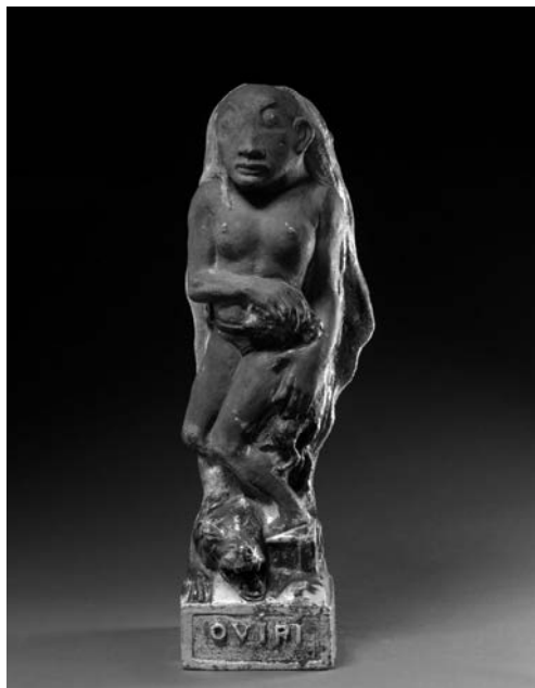
2. KÉP: PAUL GAUGUIN: OVIRI, 1894

akármilyen csúnya életet (1910); A Nagyranőtt Krisztusok (1912); Az izgága Jézusok (1914) és a Rabbiság sorsa (1915). A krisztusi párhuzam minden valószínűség szerint A föltámadás szomorúsága (1910) című modern hosszúversben éri el művészi tetőpontját. Érdekes alkotáslélektani analógia kínálkozik Gauguin nagyon expresszív stílusban készült Sárga Krisztus -a (1889) és Az izgága Jézusok ban feltűnő forradalmi „Vörös Krisztus” között.