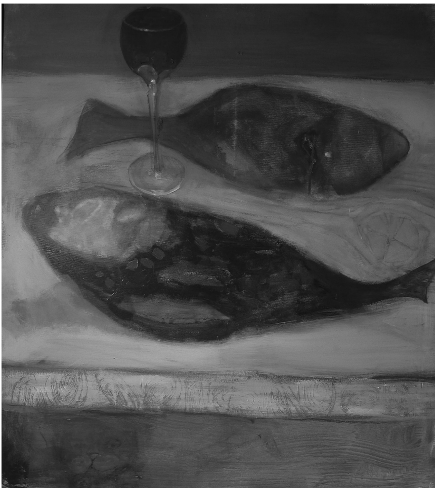
CSENDÉLET KÉT HALLAL ÉS EGY POHÁRRAL, 80×90 CM (AKRIL, VÁSZN) 2016.

Ha azonban ezeken túlteszi magát az olvasó – márpedig érdemes túltennie –, akkor a könyv nagyon izgalmas olvasmánnyá válik. Egy gyerek, majd kamasz és fiatal felnőtt szemével látjuk végig a diktatúrát, annak emberi és ökológiai viszonyait, hétköznapi élethelyzetét, életlehetőségeit. Csupa olyan helyzetet, melyek egy része a határ innenső oldaláról is ismerős lehet, hiszen a nyílt beszéddel itt is komoly problémák vannak.