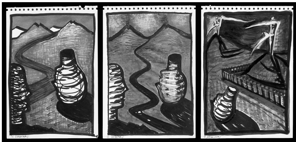
EL KAZOVSZKIJ: ÚTMENTI FEJEK év nélkül, tus, akvarell, papír, 27×17 cm, magántulajdon

Ironikus ez az összetettség, valahol napjaink ponyva irodalmának csúfolódó értelmezése. „Annak, aki valóban megtanult olvasni, a betűk a maguk rejtettségében csaknem láthatatlannak... az én nyomtatott betűim az egysejtű állatokéhoz hasonlító finom pulzáással jelzik figyelmes olvasómnak, mennyire sérülékeny dolog az írásbeliség.” – áll a regény kezdetén, egyfajta útmutatóként. Az önálló életre kelt szöveg ugyanis több, mint amit a felszínes olvasás megfejt. Az Apás születés bonyolultabb, mint általában a fülledt, szerelmi történetek, és talán fülledtebb, mint a többi, nagy igényességgel elkészített kisregény.