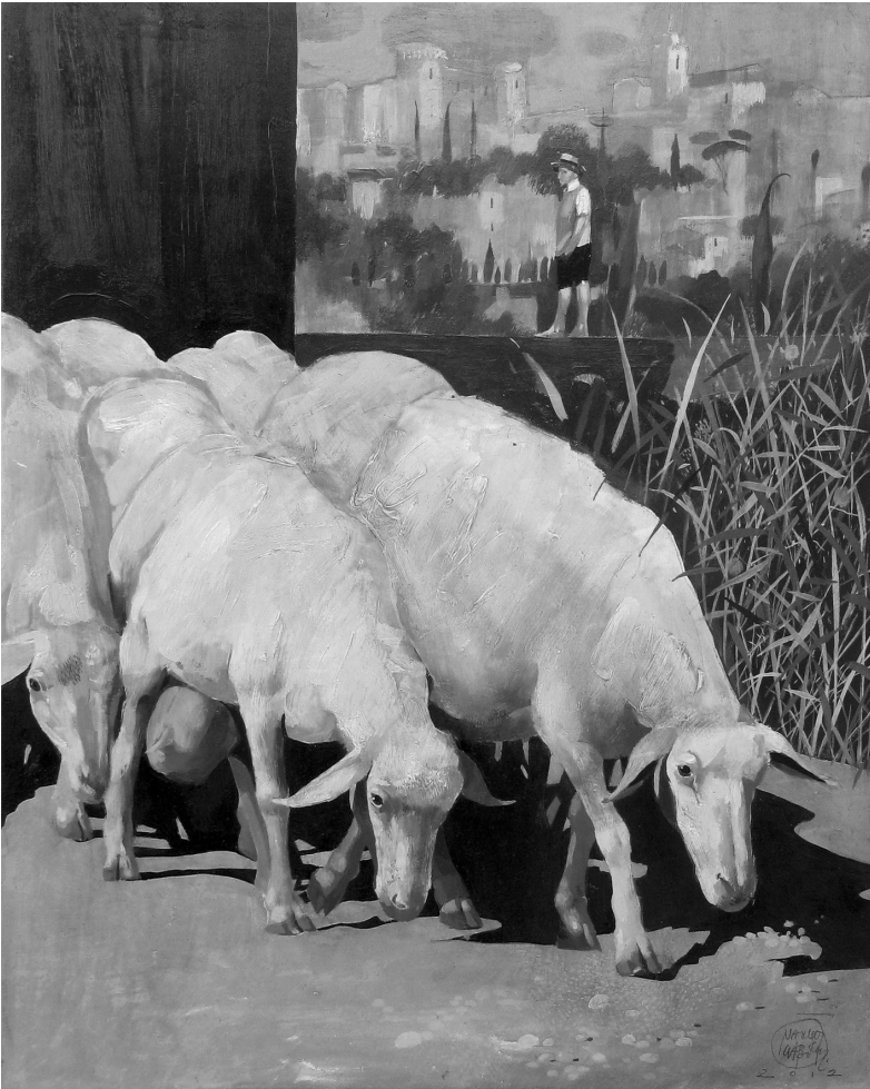
JELENET II. 2012. OLAJ.FA. 30×24 CM