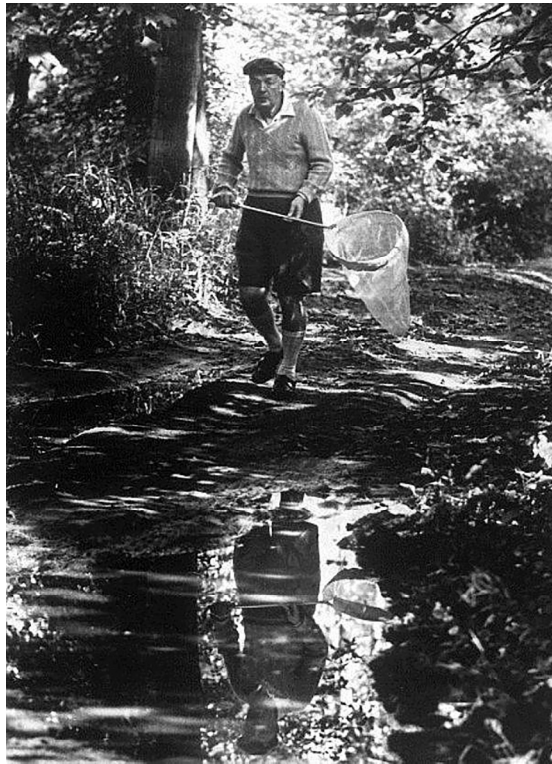
Megvetésem tárgyai egyszerűek: ostobaság, elnyomás, bűn, kegyetlenség, könnyűzene. Élvezeteim az ember által ismert legmélyebbek: írás és lepkevadászat. (Nabokov egy 1962-es interjújában)

Mindent egybevetve invenciózus, átgondolt struktúrájú, a modern magyar líra újraolvasásával kapcsolatban számos következtetést tevő, még többet felkínáló szemléletű könyvet tart kezében az olvasó.