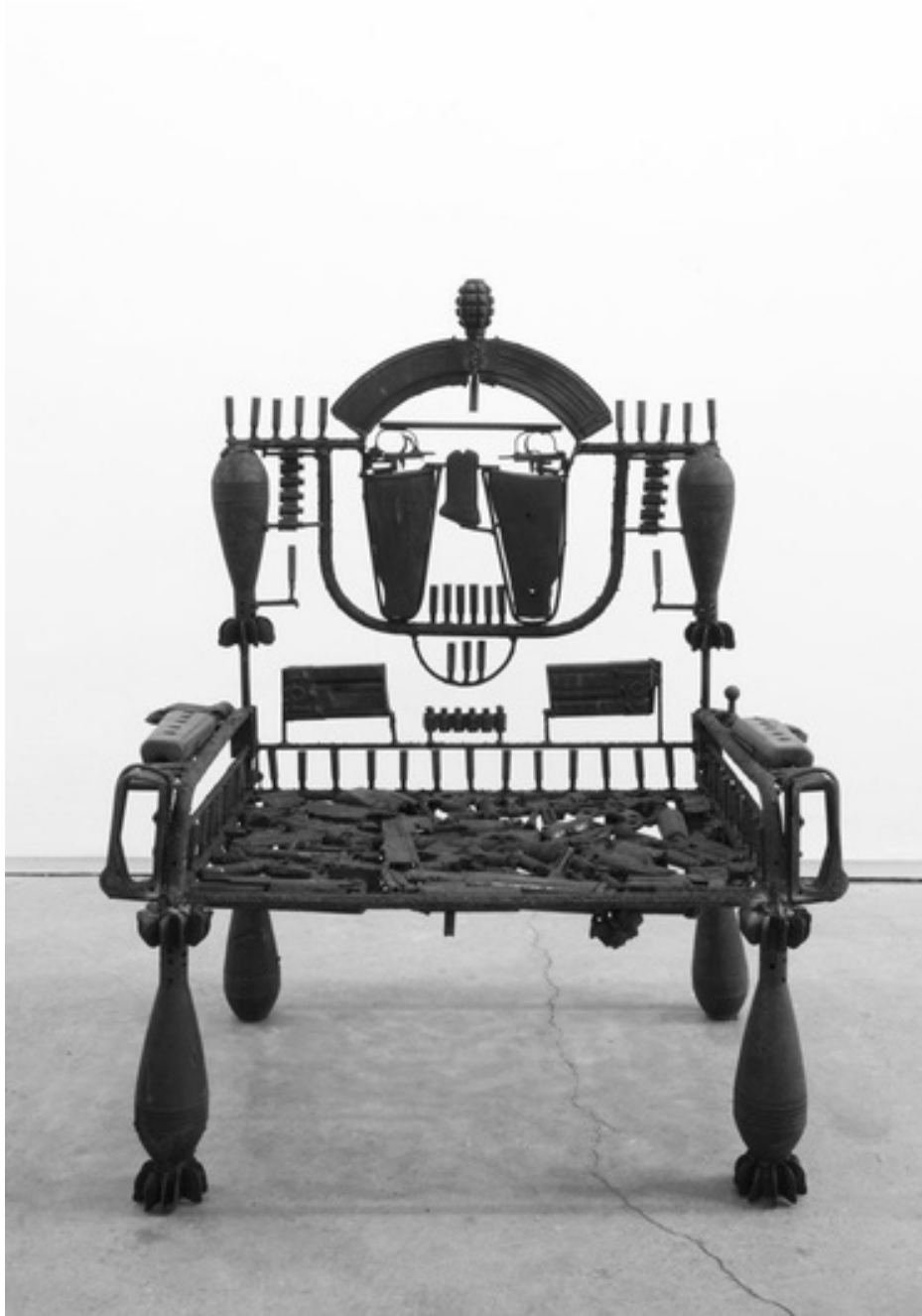
MABUNDA: THE TIP WORKER THRONE