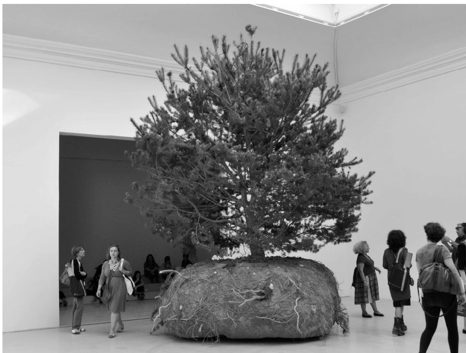
CÉLESTE BOURSIER-MOUGENOT: RÉVOLUTIONS

Miközben persze pontosan tőlük, és a hozzájuk hasonló fanatikusoktól, kellett és kell megmenteni valahogy újra és újra a világot, de ha lehet, nem egy ellen-ideológia és újabb prófécia mentén, hanem csak úgy, ceremóniamentes becsületességgel, mint a könyv igazi hőse, Miralles. Mert Javier Cercas regénye alapvetően erről a felismerésről szól: arról a múltfeltárás révén átélt átalakulási folyamatról, mely lehetővé teszi, hogy megtaláljuk magunknak azokat a példaértékű emberi magatartásokat és gondolatvilágokat, amelyek mintájára felépíthetjük a jelen trauma-nélküli társadalmát.