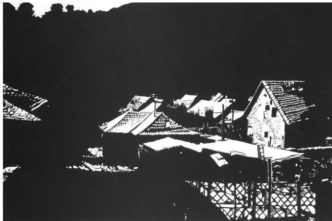
SIMON ENDRE: HÁZAK

Kőnig az ösvényen meg is botlott, gurult egypár métert lefelé. Visszanézett, káromkodott egy különösen cifrát, De aztán jobbnak látta, ha mégis Elindul a piros hórobogójához.