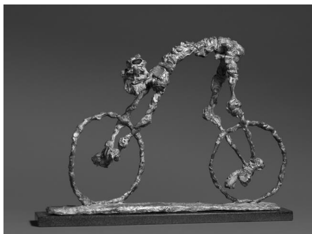
TÓTH ERNŐ: KÉT KERÉKKEL TÖBB

az éjjel súlyos látnivalói közül, a zavaros vízű patakot legalább, az unalom és a félelem felfedezése előtti korból, mikor a víz figyelése elég volt még, ahogy a felfelé úszó halak puszta ígérete is, és az sem szegte kedved, amikor a rózsaszín habokban megpillantottad a feltorlódo parókákat, gyönyörűim, mondtad, miközben egy hosszú bottal egyenként a szárazra húztad őket s ujjaiddal kifésülted a csatakos fürtökbe kapaszkodó hínárt és békanyálat, a testvéreim lesztek, ne meneküljetez tovább.