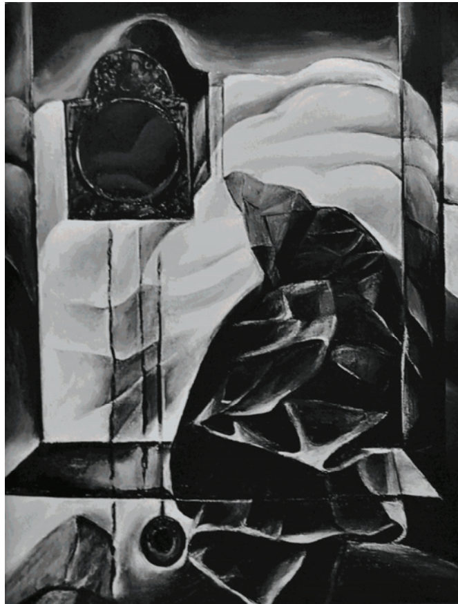
ÓRA ÉS DRAPÉRIA (2001)