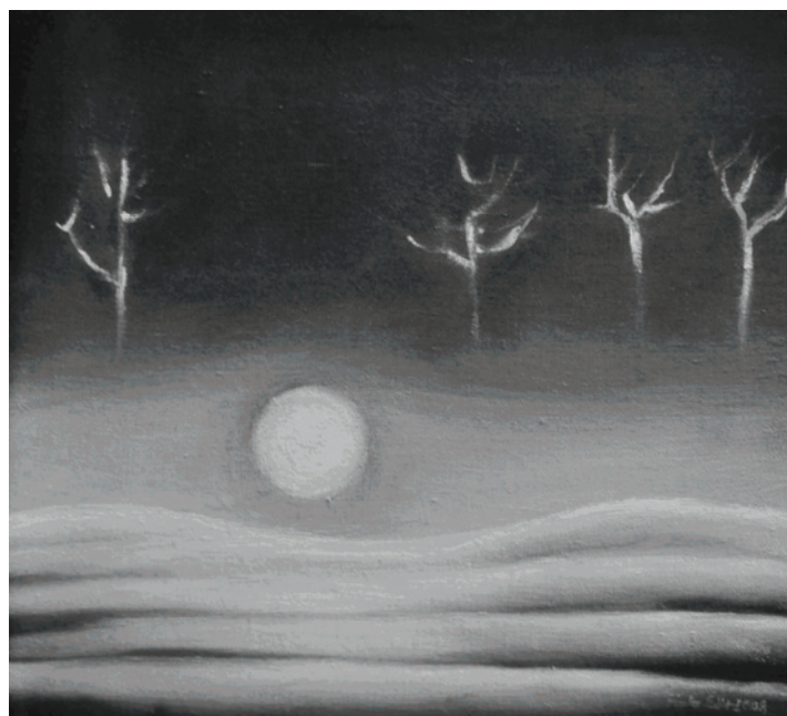
TÉLI RAGOGYÁS (2001)

Felolvasol, és szemüveged kedvesen billen félre, mikor öledbe hajtott fejemen az első szürke hajszálat észreveszed, hiszen őszülni már nem lehet akárkivel, most végre szemedbe néznék, de talán kevés leszek.