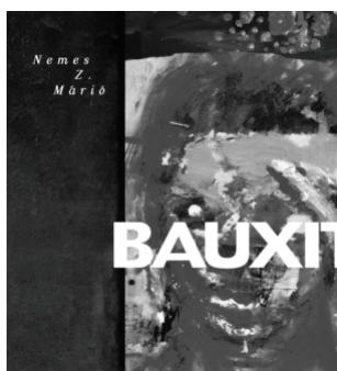
Palimpszeszt – PRAE.HU Budapest, 2010 88 oldal, 1990 Ft