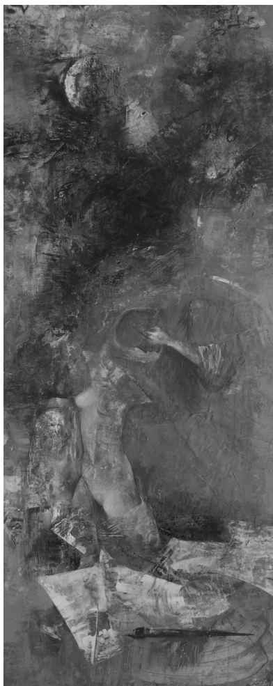
PATAKI FERENC: AZ ALKOTÁS GÉNIUSZA (1992)