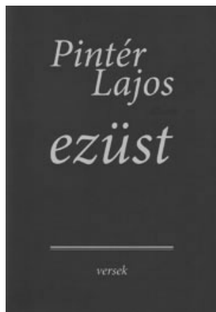
Ziccer Bt. Kecskemét, 2007 112 oldal, 2 100 Ft