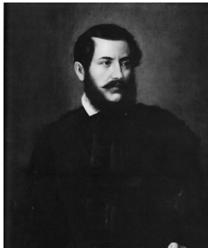
OSKÓ LAJOS: KOSSUTH LAJOS PORTÉJA

1894-ben ismét megtisztelő feladatot kapott a Kaszinótól, az éppen elhunyt volt kormányzó, Kossuth Lajos újabb olajképének elkészítésével bízták meg. Igyekezett a vállalt feladatot minél