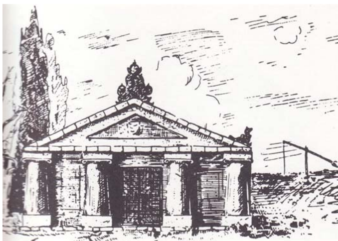
A PARASZTSZÍNHÁZ HOMLOKZATA