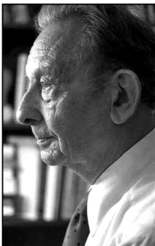
GEORGE GERBNER 1919–2005

Múlt év december 24-én elhunyt George Gerbner professzor, a kommunikációkutatás világszerte elismert szaktekintélye. Azok közé a Magyarországról elszármazott tudósok közé tartozott, akik külföldön vívtak ki nemzetközi elismertséget. Budapesten született, 1939 óta él az Egyesült Államokban. Egyetemi tanulmányait már Kaliforniában végezte. A kommunikációs stúdiumok professzoraként 1964-től 1989-ig dékánja, majd nyugdíjba vonulása után tiszteletdíjjal fellegvárává vált az Egyesült Államokban. 1990-től a telekommunikáció Bell Atlantic professzora volt a Temple Egyetemen, emellett elnökként szervezte és vezette az általa alapított Kulturális Környezet Mozgalmat (Cultural Environment Movement). Nemzetközi tudományos kapcsolataik között (számos egyetemen tanított vendégprofesszorként) kiemelt hely jutott a magyarországi társadalomtudományi műhelyekkel fenntartott együttműködésnek. Gyakori látogatásai alkalmával szakmai tanácsaival támogatta az itteni intézetek munkáját, és számos (fiatal) magyar kutatót segített hozzá ahhoz, hogy bekapcsolódhassanak a nemzetközi tudományos életbe.